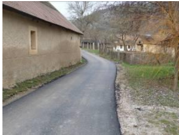
A megújult Dózsa György utca

EU-s támogatással megújult a település két utcájának – a Rákóczi- és a Dózsa György utca - burkolata, Az Önkormányzat által benyújtott pályázaton 90 %-os támogatással 11.520.848 Ft összeggel valósult meg. Kár, hogy nem sikerült ezt a jelentős felújítást összekötni a műemléki jelentőségű terület látványát rontó légkabel-szövevényt eltüntetésével!?