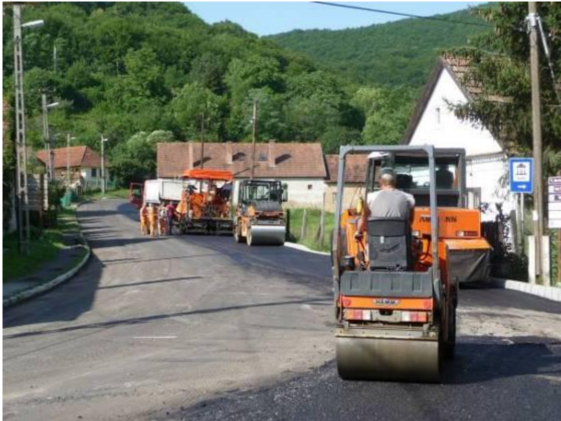
Készül az új burkolat a „Nagy kanyar”-ban