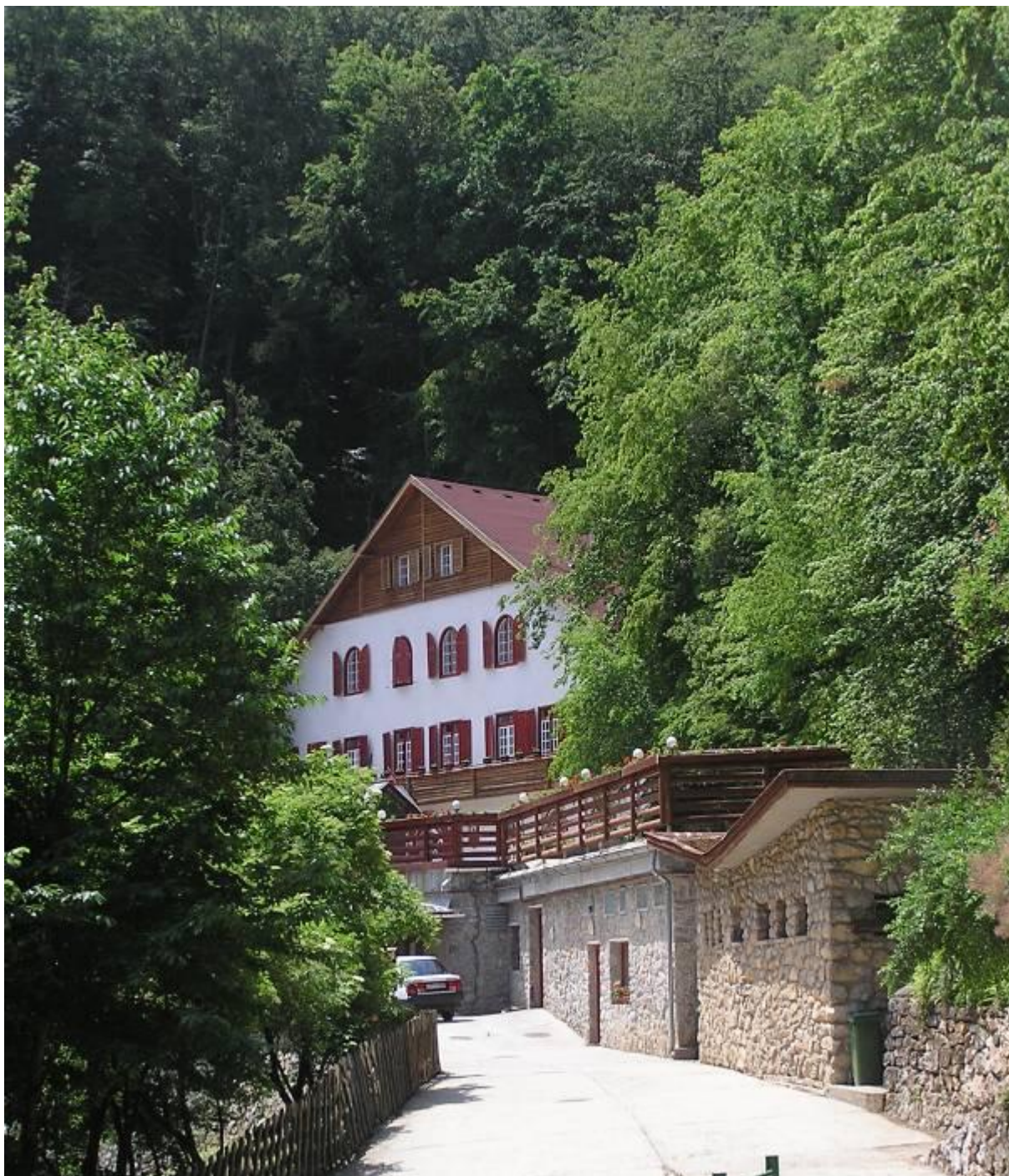
Az 1944-ben épült Tengersizem Szálló (hajdan Mátyás király Sportszálló) méltó helyszíne a „Tengersizem Szalon” rendezvénysorozatának