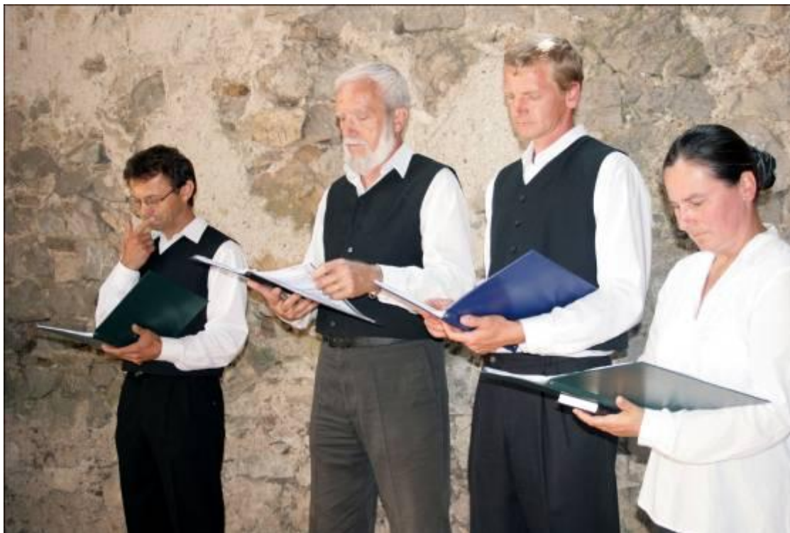
Fellépésünk a Martonyi templomban 2009. 08. 01-jén...és feszültségoldás a tájház kertjében