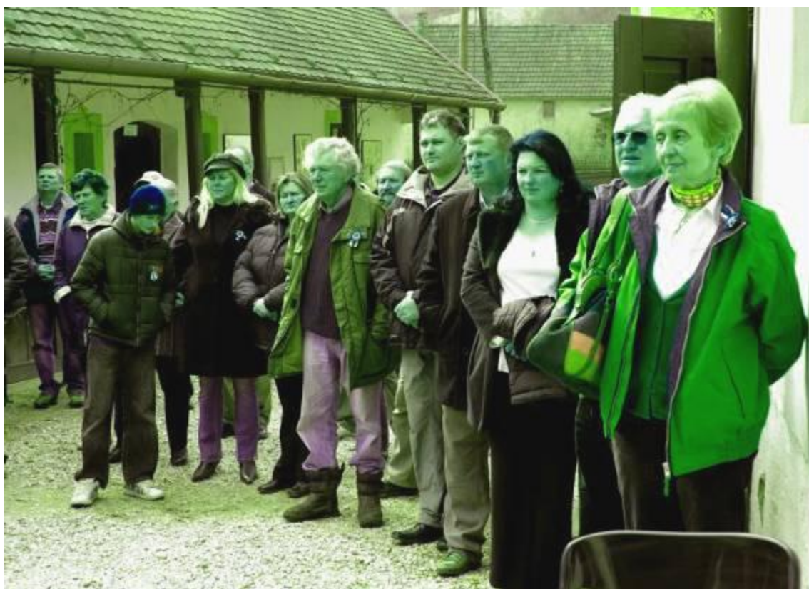
Az iskolások ünnepi műsora és az ünneplők egy csoportja