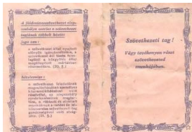
Földműves szövetkezeti részjeggy (1951)