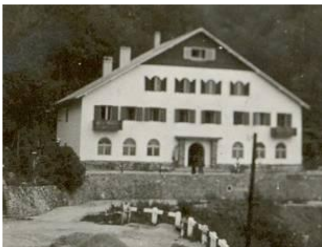
A Tengerszem Szálló megnyitásakor, 1944-ben