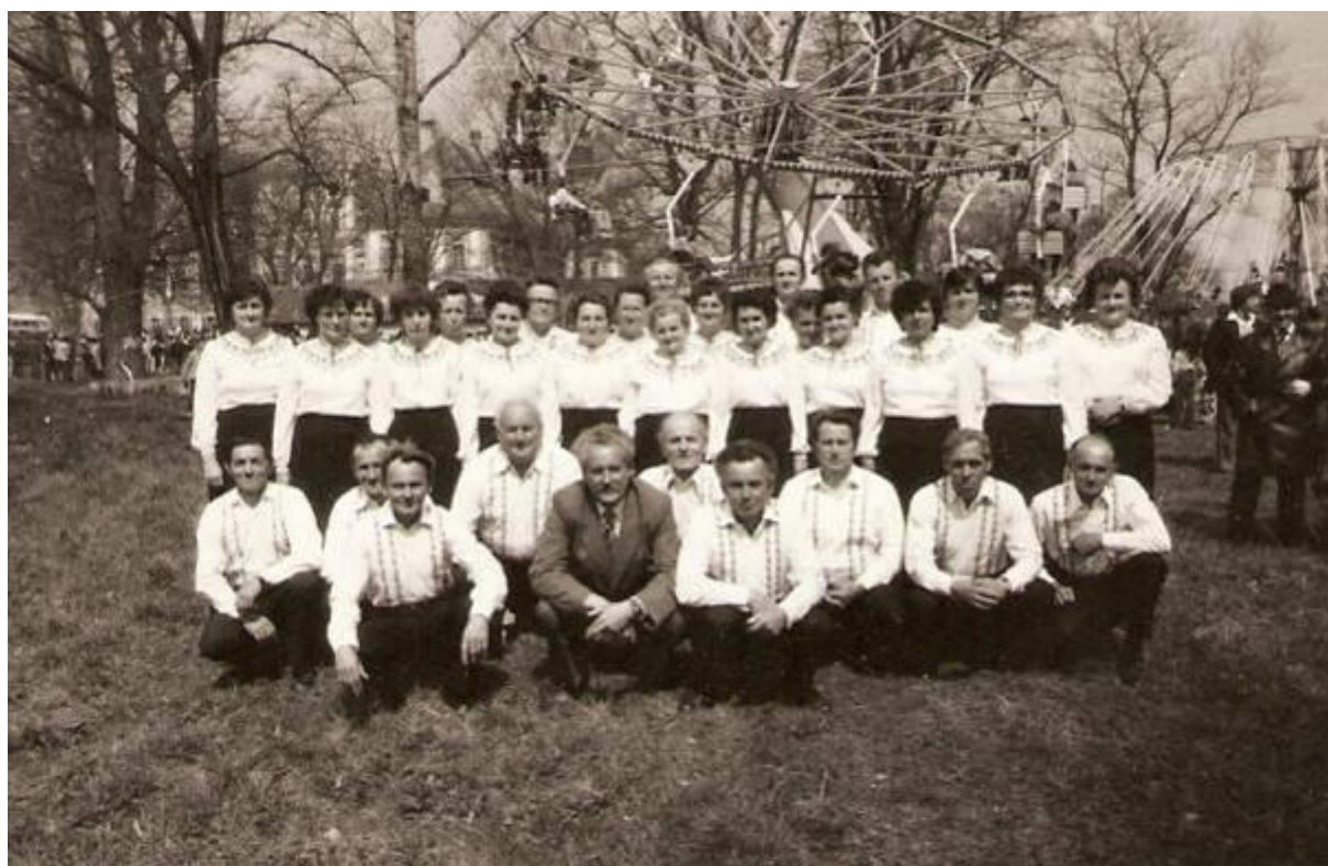
A Jósvafői Népdalkör Edelényben 1982. május elsején