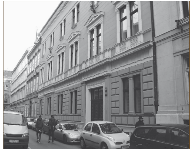
1. ábra Az első székház: Reáltanoda u. 13-15

Az 1950. évi megalakulása óta a Faipari Tudományos Egyesület, mint az akkori társadalmi felépítmény része, az államosított faipar fejlesztését volt hivatva szolgálni. Az ipar irányításában gyako-