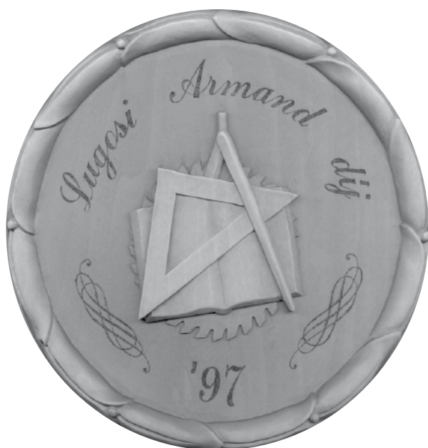
8. ábra A „Lugosi Armand-díj” (1997)

Egyesület működtetésének felelősségét, avagy tagjaiként részt vettek munkájában és jelenleg is tevékenykednek.