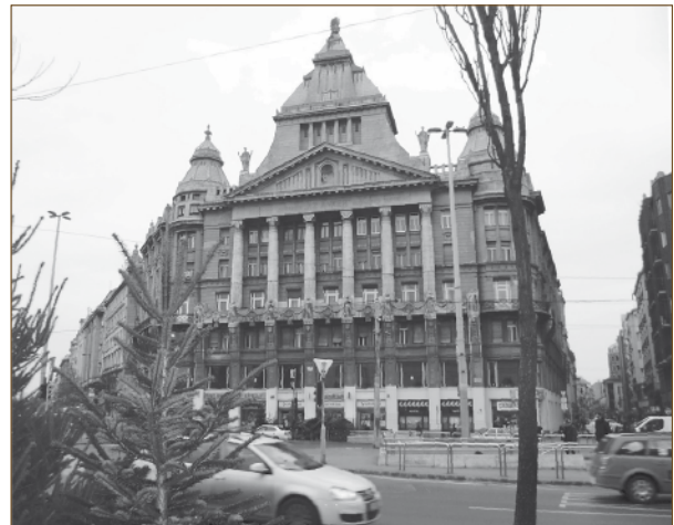
3. ábra Az Anker palota a Deák téren