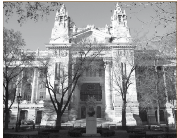
2. ábra A Szabadság téri épület