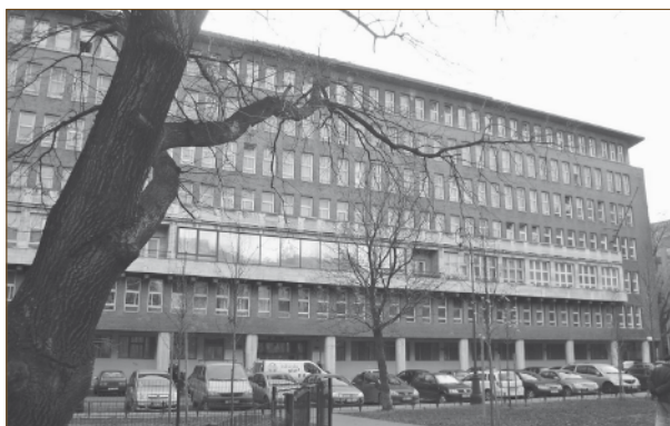
4. ábra A Fő utcai épület

riak voltak a változások: először az államosítások, az összevonások, majd a fejlesztések korszaka következett. Volt időszak, amikor a szétagolt faipar hét minisztérium felügyelete alá tartozott. Ekkortól kezdve a faipari dolgozók számára egyesületünk volt az egyedüli összekötő kapocs, a színvonalas szakmai fórum. Választott vezetői állami és szakszervezeti tisztségviselők, majd a vállalati, szövetkezeti vezetők lettek, akik társadalmi munkában látták el feladataikat. Jelentős támogatást kapott a FATE a jogi tagoktól; vállalatoktól, intézményektől is.