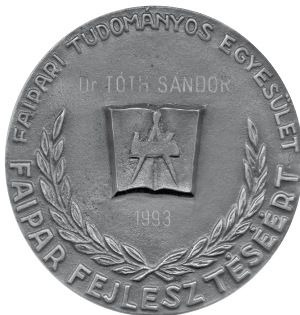
7. ábra A „Faipar fejlesztéséért” emlékérem (1993)