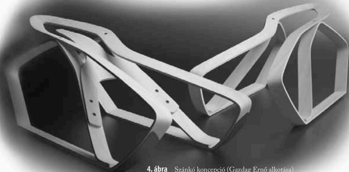
4. ábra Szánkó koncepció (Gazdag Ernő alkotása)

sikeresen lehet kimunkálni a kölcsönösen előnyös együttműködés pályáit. A kari kutatási programok művészeti vonatkozásai az intézeti munka biztos szakmai és anyagi bázisa.