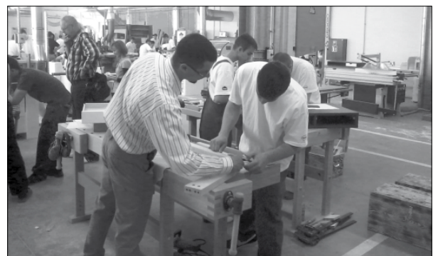
1. kép Asztalos verseny