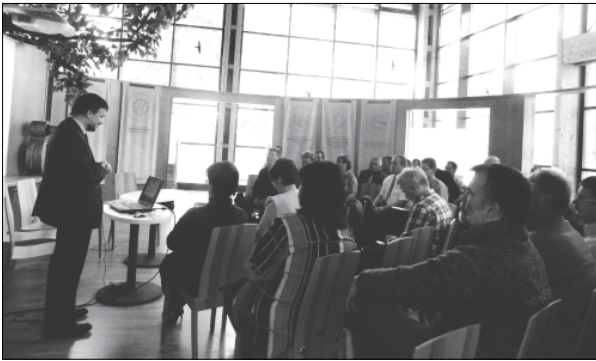
2. kép Szaktanárok V. konferenciája

kamara fejlesztő referense a szakképzés átalakításáról fejtette ki a kamara véleményét. A szaktanárok véleménye több esetben eltért a kamarai elképzelésektől. A felmerült kérdésekre az előadás után rögtön választ kaphattak a jelenlevők.