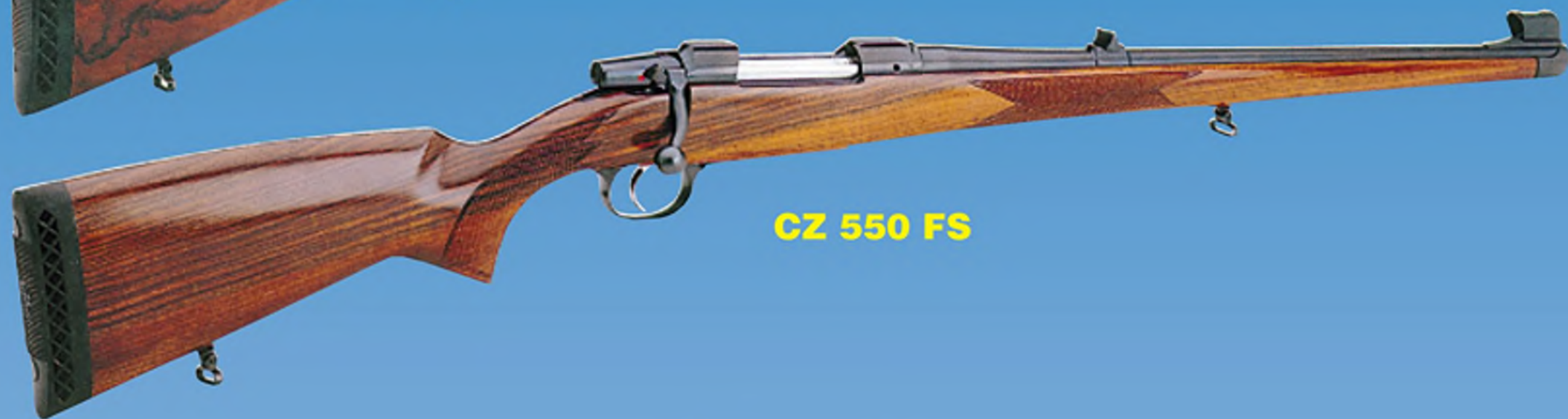
CZ 550 FS