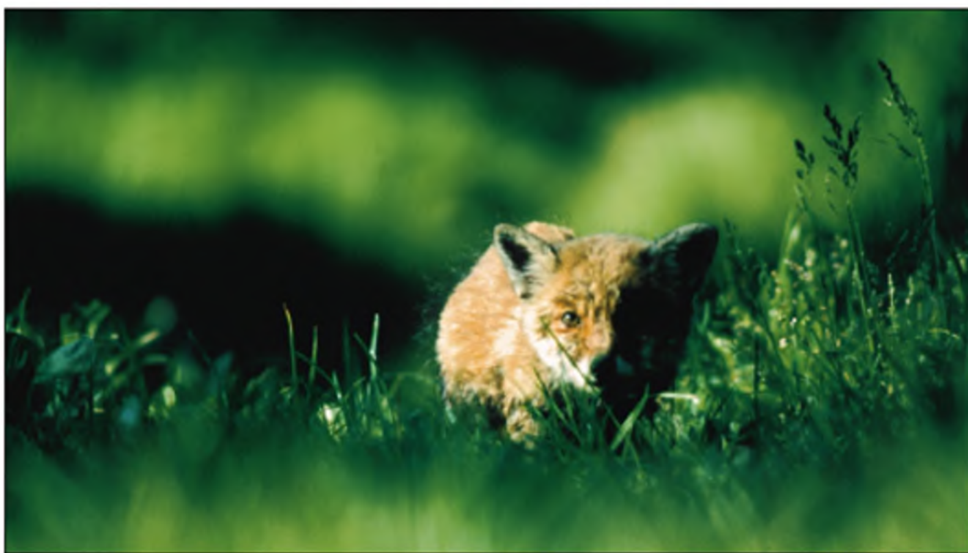
TÖRÖK JÓZSEF: TALÁLKOZÁS II. DÍJ

Manapság nagyon nehéz nívós, versenyképes természetfotó kiállítást tető alá hozni. A Magyar Természetfotósok Szövetsége által kiírt pályázatok és az azokból rendezett