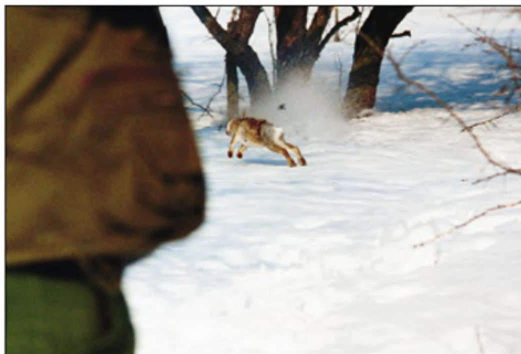
POLSTER GABRIELLA: NYÚL-LÖVÉS