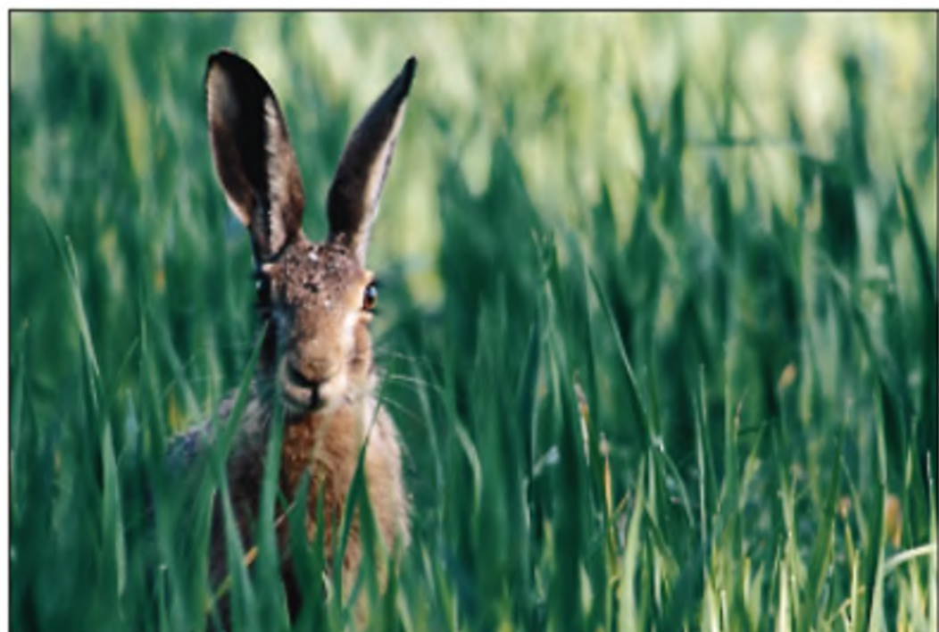
SZEGEDI KÁLMÁN: NYÚLPORTRÉ