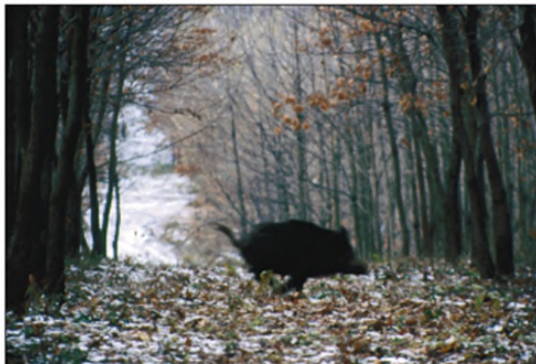
ANTLI ISTVÁN: FUTTÁBAN