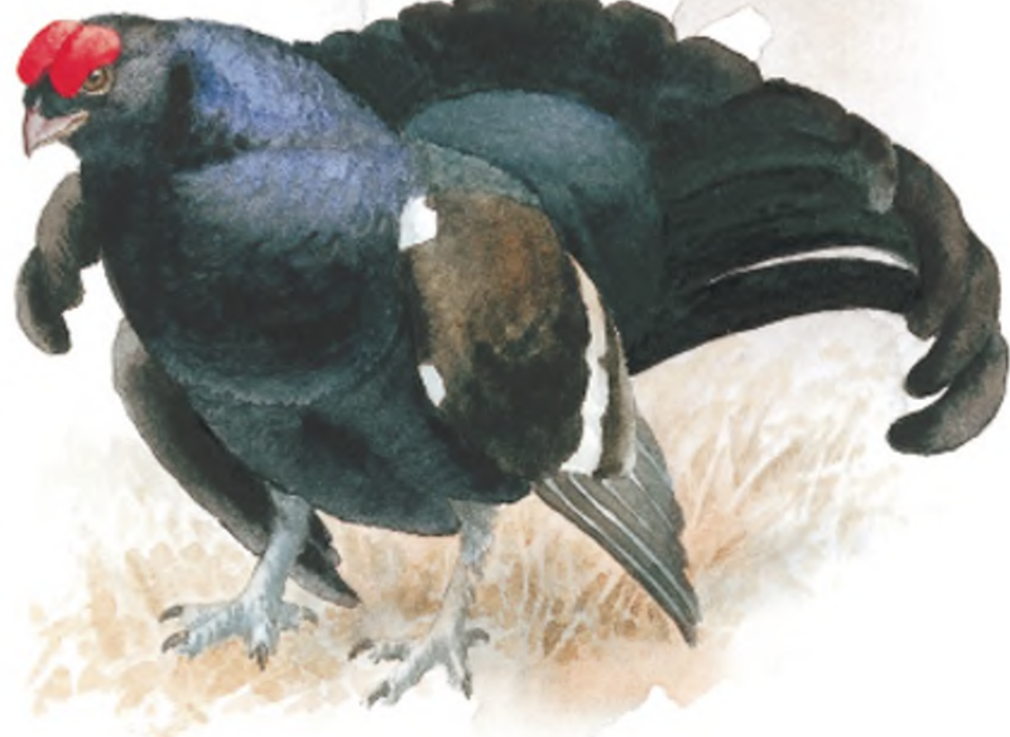
ILLUSZTRÁCIÓ: MESZLÉNYI ATTILA

A nyírfajd többnejűségben él, a dűrgési időszakban a kakasok jellegzetes násztáncot lejtnek.