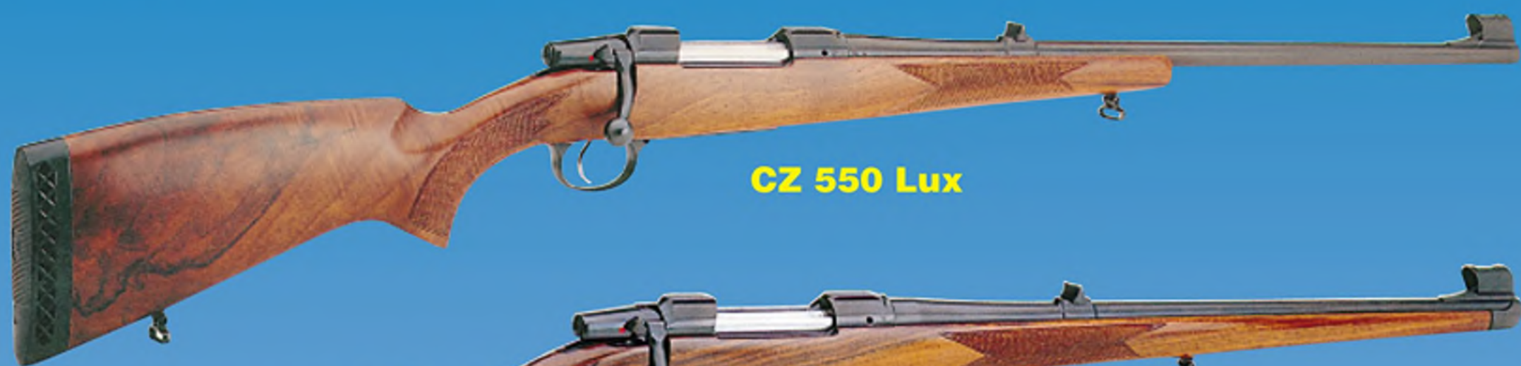
CZ 550 Lux