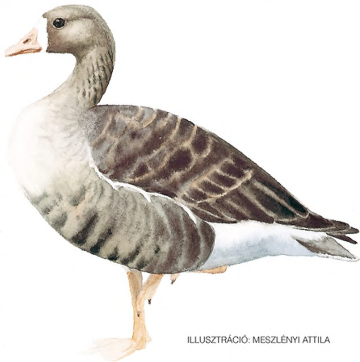
ILLUSZTRÁCIÓ: MESZLÉNYI ATTILA

A nagy lilik a lúdfélék (Anseridae) családjába tartozik. Valamikor hazánkban – főleg a Tisza szabályozása előtt – átvonuló állományát „megszámlálhatatlannak” tartották. A „temérdek” nagy liliket főleg február vége – március eleje és október végétől november 20. között figyelhették meg a vizek, mocsarak, nedves gyepterületek vidékén, ezért nevezték el „magyar libának”. Hangja, kiáltása a jellegzetes „lii-lik-lii-lik-lii-lik”. E hangot a szomszédos románok „clii-clik”-nek említik, de hasonlóan utánozzák – elnevezésükben – a szláv ajkú népek is. A tudományos, a latin „albifrons” elnevezés az idősebb példányok esetében a csőrt és homlokot beborító fehér foltra utal. Erdélyben ezért „fehér homlokú” libának nevezik, amely valamivel kisebb a vetési lúdnál. Az idősebbek az úgynevezett „szürke ludak”-hoz tartoznak, begyük és hasuk szürke alapszíne miatt. Feje, nyaka, háta barnás, az idősök mellén keresztben széles, fekete harántsávok húzódnak, gyakran össze is olvadnak, messziről sötét színt adva a lúdnak. Csőre hús-színű, sötét hasmintázata hiányzik, mellük és hasuk egyszínű szürke. A fiatalok húsa nagyszerű pecsenye, az öregeké meglehetősen rágós.