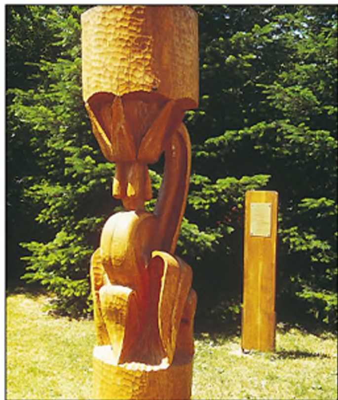
„Kakas-mandikó” – Kaposvár

– Az első Kaposváron, a Megyeháza előtt áll. Minden szobor egy-egy különleges és jellemzően zselici növényt, virágot ábrázol. Az első szobor „modellje” a kakas-mandikó. Ez a virág annak a különleges, szimbolikus hídnak az első pillére, mely a modern, XXI. századi várost összeköti az őstermészettel. A „Vadvirág út” Szilvásszentmártonban ér véget, ahol autóval már tényleg nincs tovább. Erdei ciklámen, mocsári nőszirm, ökörfarkkóró, őszi füzértkercs „áll őrt” az út mentén – hogy csak néhányan említsek a huszonegyből –, mely őt településen halad át. Azt remélem, hogy ezek