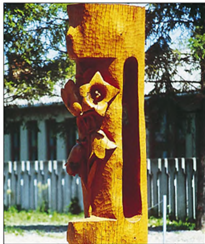
„Baracklevelű harangvirág” – Szenna

– Vadász – puska nélkül...? – Képtelenségnek tűnik, de lehetséges. Van, aki fényképezőgéppel „vadászik”, én a sze-