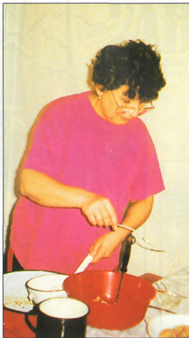
Kati asszony könyvelő és külön pörköltet főz, mint a férfiak...