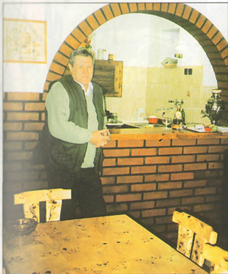
A szívélyes, fesztelen, már-már familiáris közvetlenség a vadászat „járulékos” értékeinek egyike...