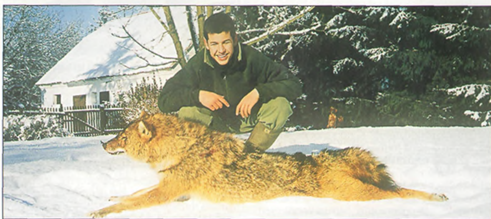
Rekord méretű sakál, elesett múlt év karácsony napján.

lepszik, akár itt is neveli fel utódait (hiúz), de elszaporodásukhoz, pláne, elszaporításukhoz – vegyük már tudomásul – nincsenek meg a feltételek. (Ha meglennének, már rég maguktól elszaporodtak volna...)