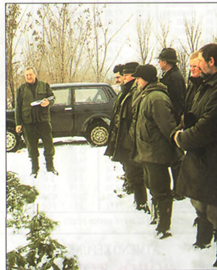
Eligazítás. Aki egy perccel nyolc óra után érkezik, fizet...