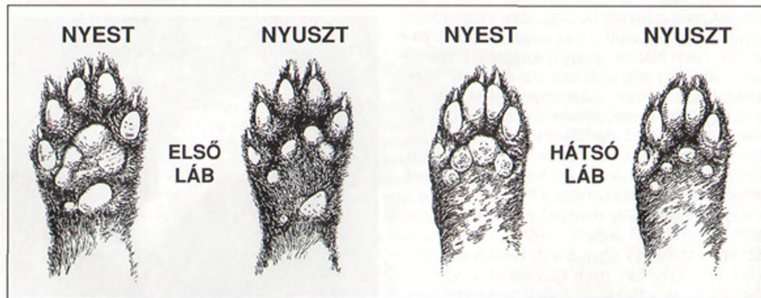
ILLUSZTRÁCIÓ: MESZLÉNYI ATTILA