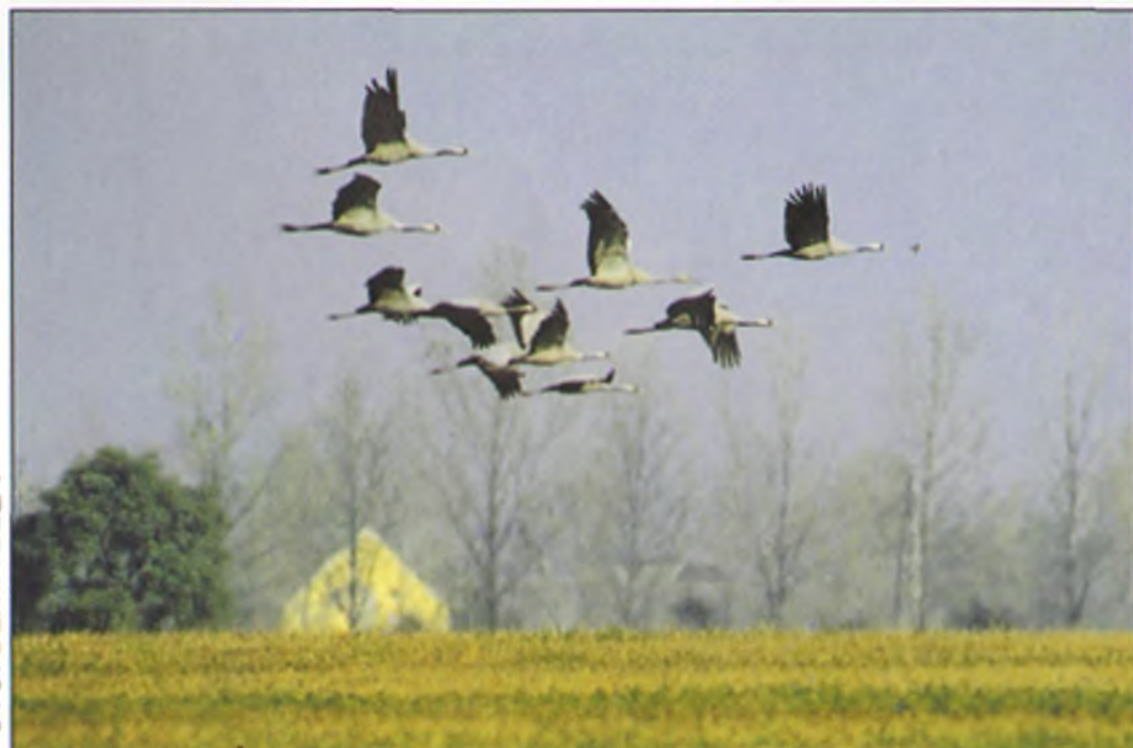
FOTÓ: BERTA BÉLA

A képek alkotói a Nimród Fotóklub tagjai