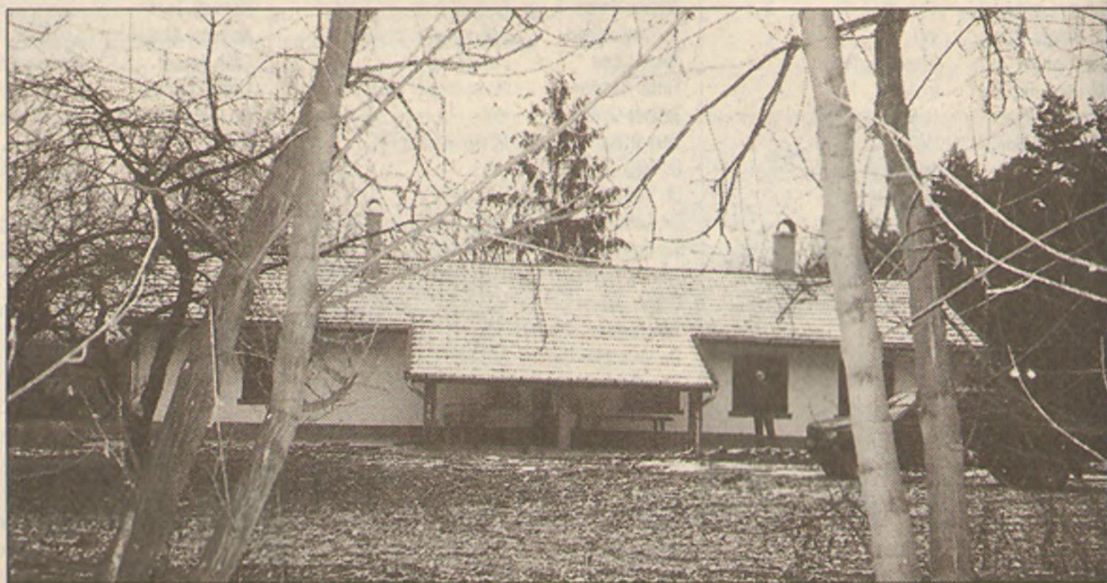
Száz évvel ezelőtt 2957 tanya volt Cegléd határában. A gyermekevek színtere ma emlékeket őrző hétvégi ház

A Déllő utcai ház az alföldi mezővárosok utcafrontos polgárházainak mintájára épült, ilyen házakban laktak azok a módos, előrelátóan és