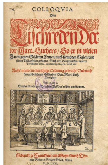
Az Asztali beszélgetések 1571-es kiadásának címlapja

A keresztény tradíció más-más vonulatából táplálkozó emberképhez társult a pogány örökség gyökeresen eltérő