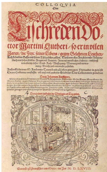
Johann Aurifaber 1568-as Tischreden-kiadásának címlapja