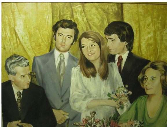
2. kép – a Ceausescu család portréja

A Ceausescu család már ekkor a kiváltságos kommunista elit életét élte, és Nicolae-nak még zavaró dadogását is sikerült leküzdenie felesége segítségével.