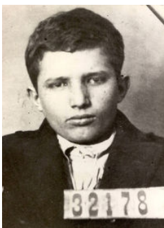
1. kép – a 15 éves Nicolae Ceausescu

Először 15 éves korában tartóztatták le őt a rendőrök: egy utcai verekedésbe keveredett, amit később Ceausescu parancsára úgy állítottak be, hogy egy politikai tüntetésben vett részt.