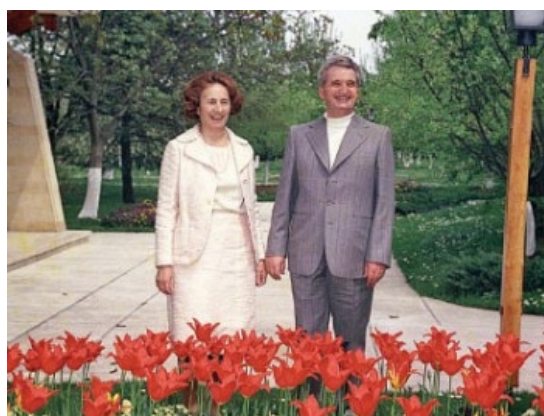
1. kép – Elena és Nicolae Ceausescu

Szabadulása után szinte azonnal kinevezték a Kommunista Ifjúsági Szövetség titkárává. Kezdtett megerősödni helyzete, így 1945 folyamán feleségül vehette Elena Petrescut.