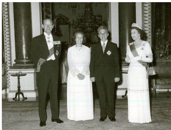
3. kép – Az angol királyi párral

Későbbi külföldi utazásaikról úgy döntöttek, hogy egy földgömböt megpörgettek és találmányra beleböktek egy gombostűt. Ahova pedig a gombostű beszűrődött, ők oda mentek. Így jutottak el Nagy Britanniába, Franciaországba, Bulgáriába, Argentínába, USA-ba stb. Persze ezeken az utazásokon a Ceausescu házaspár úgy viselkedett, mint akik egyenesen királyi származásúak voltak. Nagy Britanniába például el is várták, hogy egyfajta koronázó szertartást szervezzenek nekik. A Királynő persze vonakodva, de teljesítette a kérést.