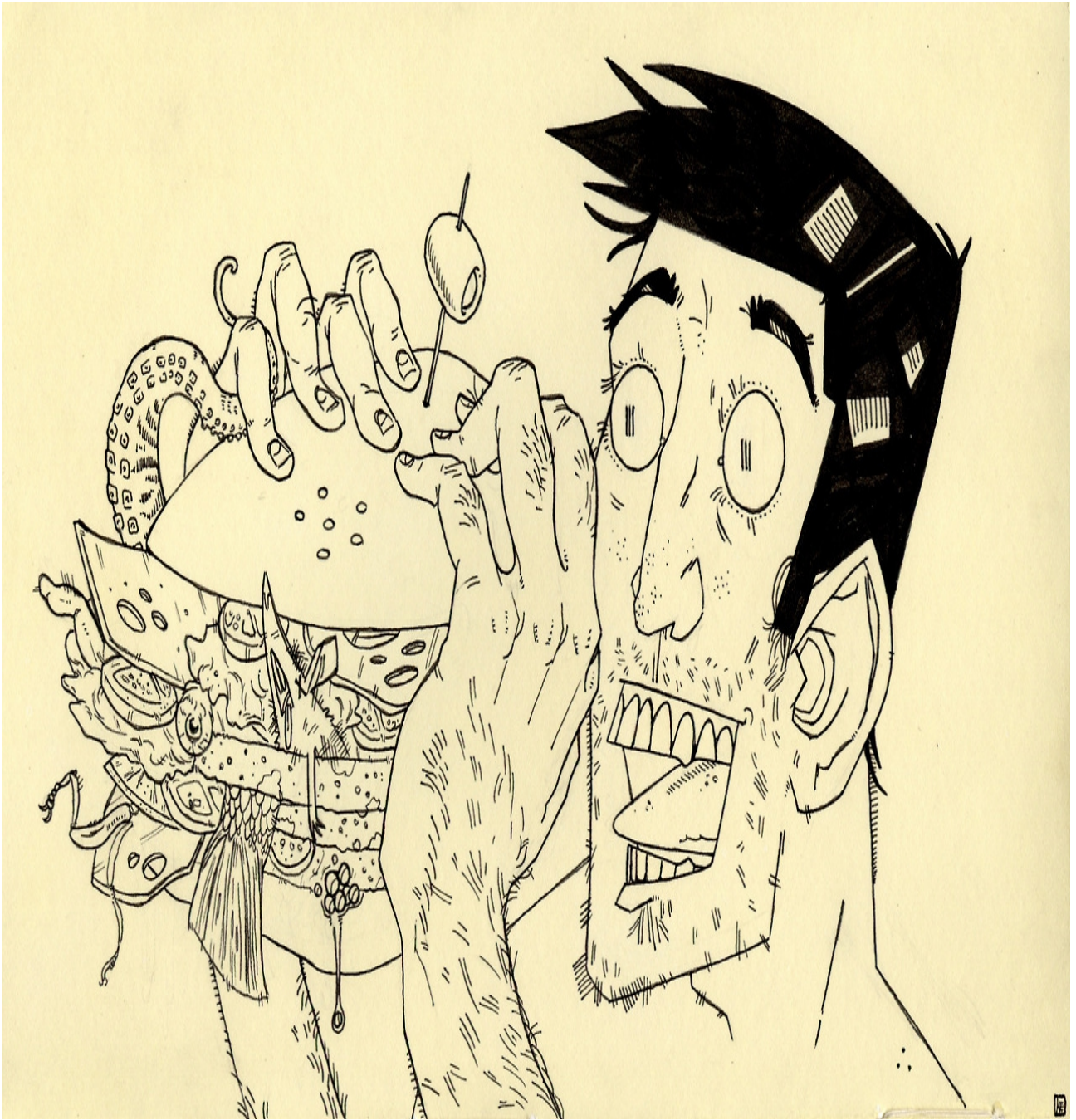
HARÁNT ERVIN munkája