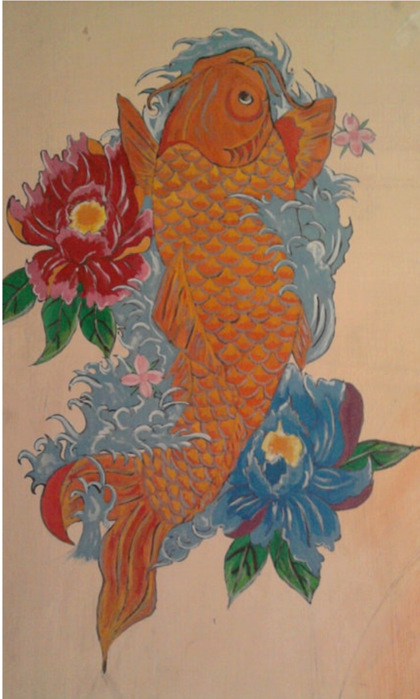
NAGY KLÁRA munkája