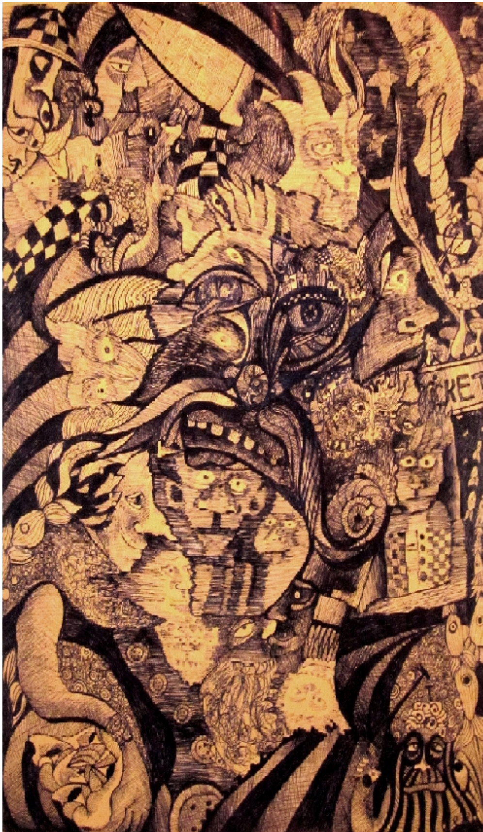
PLESZKÁN ÉCSKA munkája