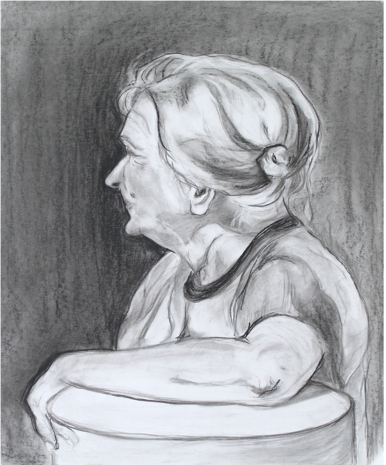
Pusch Réka munkája