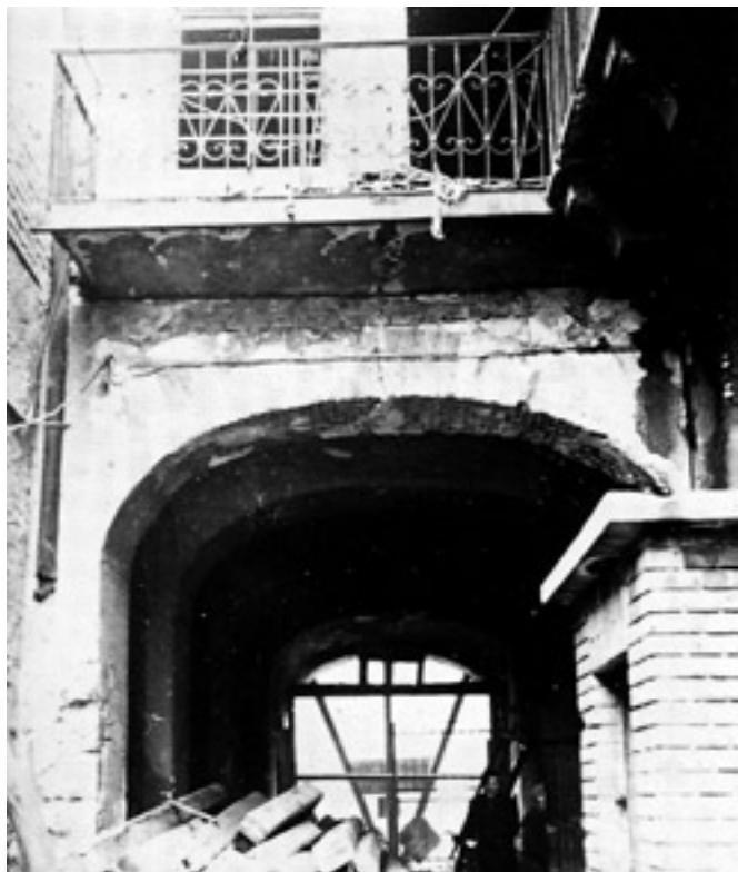
A Ferenczi ház romjai, 1963