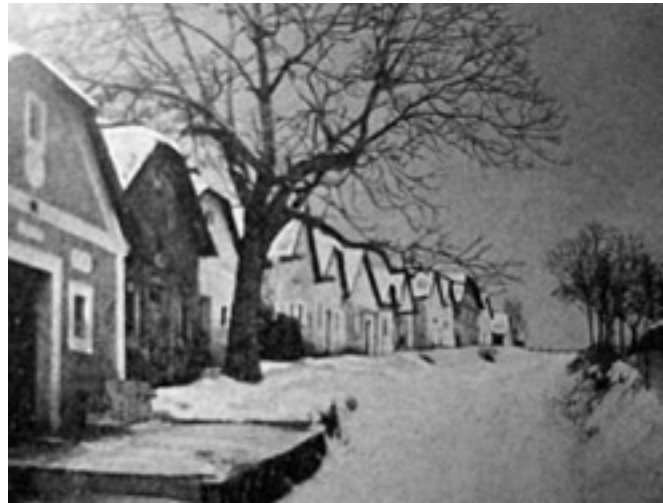
Tetenvári pincesor a múlt század elején

(1) Észak, észak: hideg és halál, nálunk pince meg temető! A Bükk magaslatai felől — körzőként szétnyíló — dombvonulatok kísérik a Szinva patak miskolci völgyét a magyar alföldre. Délről az Avas zárja a hegylábi szőlőkultúra kettős „paravánját”, északi irányból pedig a Tetenvár a síkságot elérő dombvonulat utolsó eleme. Miskolc belvárosát e nevezetes lankák jelzik az országúton érkezőnek. A Tetenvár felső részén, az Akasztóbércen álló háromágú bitót még a kiegyezés küszöbén is látják a Felvidékről, Gömörből utazók. A domb belvárosra néző oldalán fa-, illetve deszkateplom áll, mellette fekszik a temető, melynek morbid nevét köszönheti a Tetenvár. Élménye mégis ambivalens, Ferenczi korában egyfajta helyi Tabán a borospincék százait magában rejtő domb. Kaszárnya és hadikórház áll akkoriban a pincék között, alattuk pedig piac nyüzsgött a Tetenvári (mai Petőfi) téren. A vásári forgatagban gyakori áldomást ivó kereskedők és az unatkozó katonák jelenléte, a pincék bora, a temetőt meg a zezugos utcákat övező természetes környezet remek lehetőségeket kínálnak az örömlányok felajánlkozásához. Sajátos vigalmi negyed szerepkört is betölt tehát a baljós nevű Tetenvár. Emberi számítás szerint: a környék toponímiája, lüktető forgalma és jellegzetes hangulata kell, hogy foglalkoztassa a kamasz Ferenczit. Jár arra, szokásos útja van a Tetenváron, hiszen apja ottani pincetulajdonos. Kiküldik vajon a pincébe borért a gimnazista Sándort? Elcsavarog a fiú, beba-