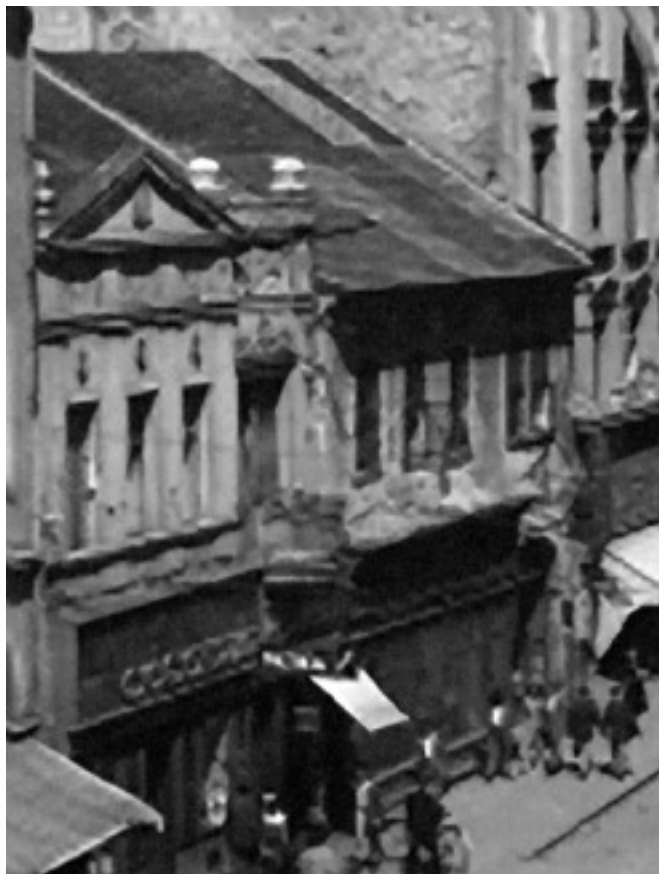
A szülőház fennállásának utolsó éveiben