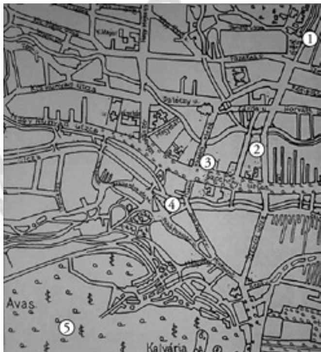
Az eltévedt emléktábla

Helyszíneink (1 — 5) Adler K. 1884. évi térképén jelölve