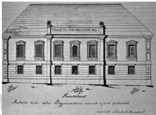
A gimnázium 1879-ben

(Széchenyi u. 11. szám) nyitni készül, idő van, szaporázni kell hát a lépteket. Belehúz a Püspök (mai Rákóczi) utcán, végigdönget a Szinva patak hídján. Jobbra, azaz nyugatra fordul, még 60 — 80 méter és eléri a református gimnázium épületét (a mai Papszer u. 1. szám). Komor, több száz éves iskolába jár, ami ugyanakkor patinájával sem ósdi.