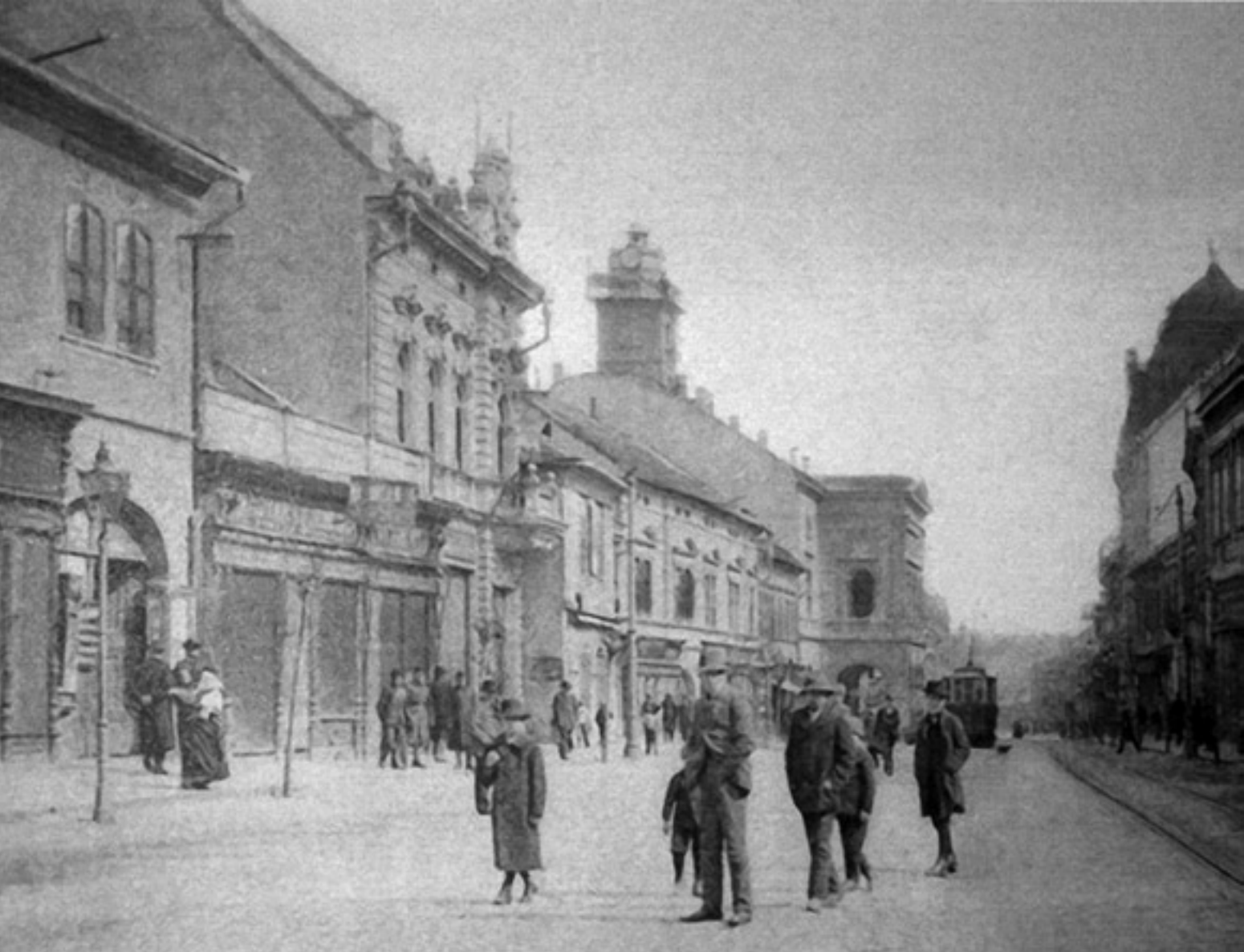
A Ferenczi dufarttól (felette a cégtábla „B”-je) a tűztornyos színházig