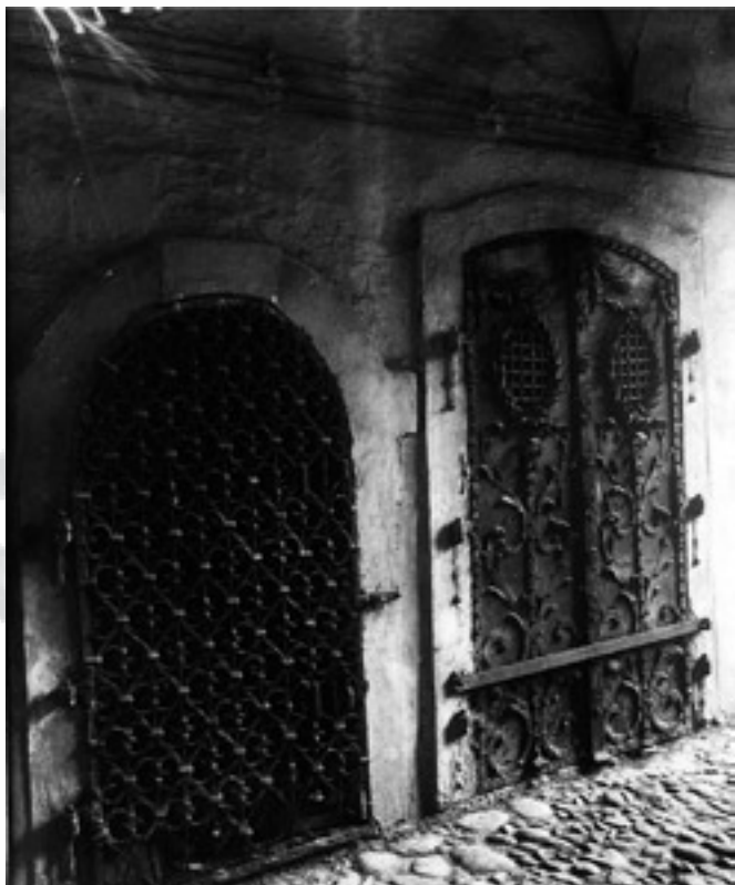
Muzeális vasajtók, amikor még a Ferenczi családot szolgálták

(3) Elképzelhetjük, ahogyan a tetemvári pincéből hazafelé sétál az ifjú Ferenczi. Gondolatban követhetjük, amint végigmegy a Kazinczy utcán, a zsinagóga előtt átkel a Pece patak fölül emelt Vereshídon, majd a Három Rózsa Szálloda grandiózus saroktömbjénél (épült 1878-ban) jobbra fordulva, kiér a főutcára. A színház oldalában halad, maturandusként már a tűztornyot is látja Tália helybéli szentélyén (a máig emblematisztorony 1884-ben kerül a színház tetejére). Megáll a királyi törvényszék (valahol a mostani Széchenyi utca 17 — 19. szám helyén volt egykori épület) előtt, gyönyörködik a pusztító árvíz után felújított szemközti házakban (Széchenyi utca 12 — 20. szám). Pár lépés múlva már otthon van. A földszinti könyvesbolt kiarakata mellett nyíló vaskapun bejut az udvarra. Áthalad a dufart alatt, balra fordul, benyit a házba. Rejteget valamit a pincében? Nem, felfelé indul a lépcsőn, rövidesen átlépi a családi otthon küszöbét: a korabeli Széchenyi 73. (1900-tól: 13.) szám emeleti lakrészén találja magát.