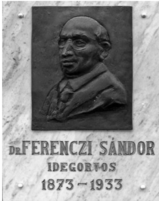
A névadót ábrázoló emléktábla

A gyermekkori otthon; iskola; templom és temető; szabadidős környezet — néhány elem az életút korai szakaszának topográfiájából. E terek és helyszínek respektusát kétségtelenül emeli Ferenczi Sándor egykori jelenlétének — a köztudatból eleddig hiányzó — ténye. Miskolc büszke lehet a relációra, és talán a Ferenczi biográfiában is hangsúlyosabb szerep illetné a szülővárost. Alakul, élesedik a kép, de szinte bizonyos, hogy számos érdekességet és tennivalót tartogat még a világhírű tudományos karrier bölcsője.