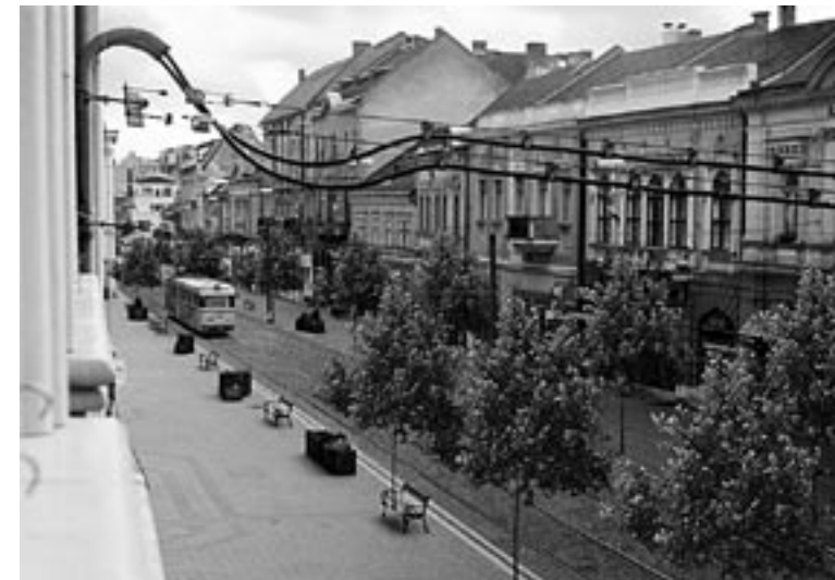
Villamospálya-rekonstrukció — V+A Kft.

— A közelmúlt történéseivel nem szeretnék foglalkozni. Igaz, ha nem hagyott nyugodni valamelyik városi épület képe, illeszkedése a környezetéhez, eddig is megrajzoltam magamnak,