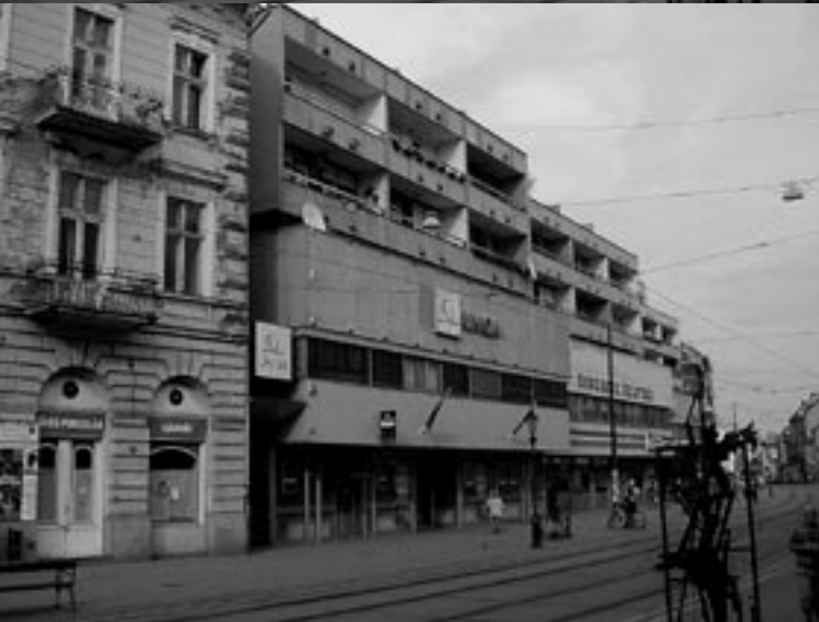
A Pátria-tomb rehabilitációja — V+A Kft.