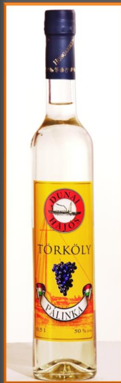
Dunai Hajós Törköly pálinka