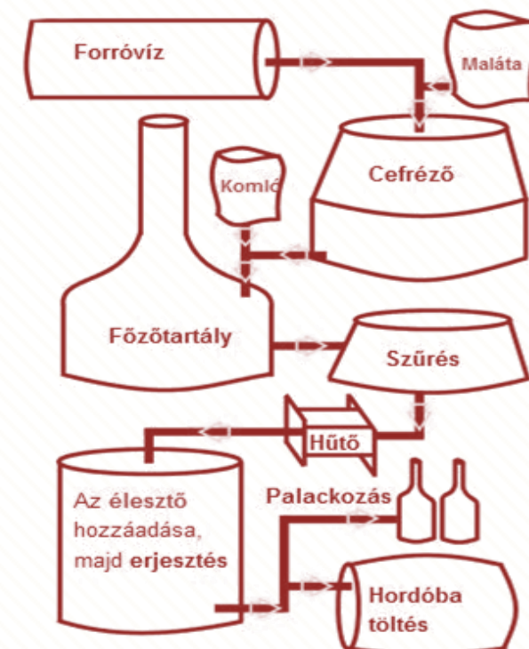
A sörfőzés folyamata

népek, etnikumok tradícióiban, italfogyasztási, étkezési szokásaiban. Mértékkel történő fogyasztása közben jusson eszünkbe, hogy ez az aranyó nedű mennyi fejlődésen és változáson esett át az elmúlt több ezer évben.