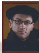
Bercz Edgár írása