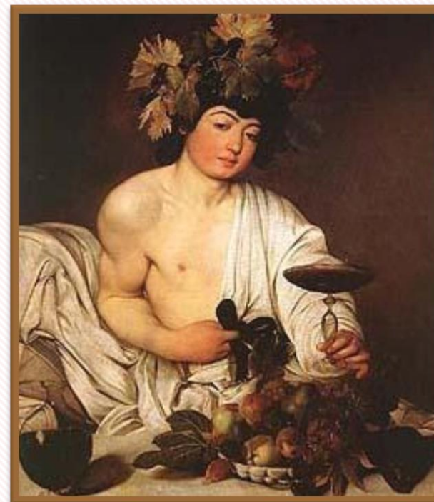
1. kép - Caravaggio: Bacchus

Nemzeti Himnuszunk sorai nem véletlenül szólítják meg a Teremtőt. A hegyalján termő édes aszú már a középkorban is kedvelt ital volt Európa uralkodóinak asztalain. A lengyel, később a francia, és az angol udvar is felfedezte a magyar borok, azon belül is a Tokaji borok varázsát. Társzekereken szállították a gönci hordókban érlelt csodát, Bacchus nemes italát. Az elkövetkezendő sorokban magáról Bacchusról, a szüretéről, a szürettel kapcsolatos felvonulásról, bálról, népi szokásokról szeretnék megosztani néhány gondolatot a kedves olvasókkal.