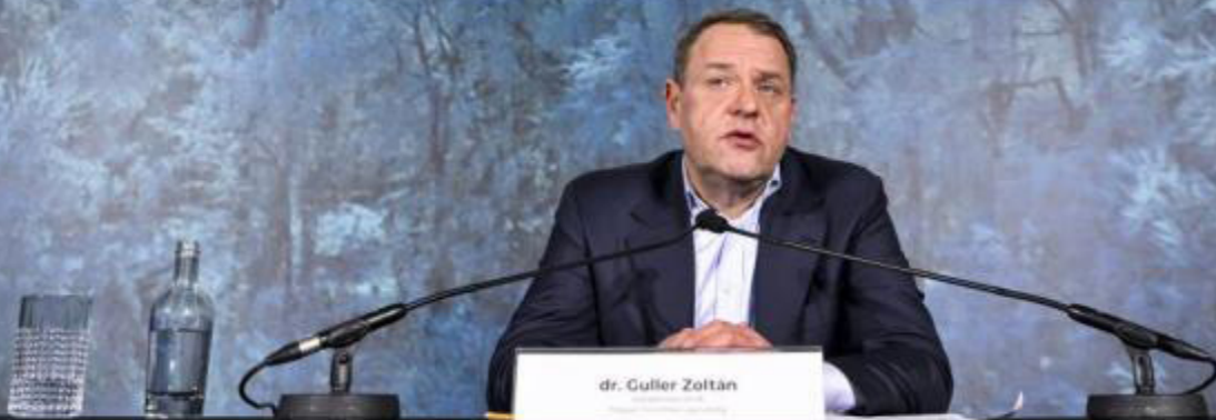
Budapest, 2026. január 12. Guller Zoltán, a Magyar Turisztikai Ügynökség (MTU) elnöke a turizmus 2025. évi előzetes eredményei értékelő sajtótájékoztatón Budapesten 2026. január 12-én.

növelése, és a jobban költő turisták bevonása. Nem az a cél, hogy a 20 milliós vendégszámot folyamatosan növeljék, hanem azon dolgoznak, hogy a minőségi szemlélet jön előtérbe - fejtette ki.