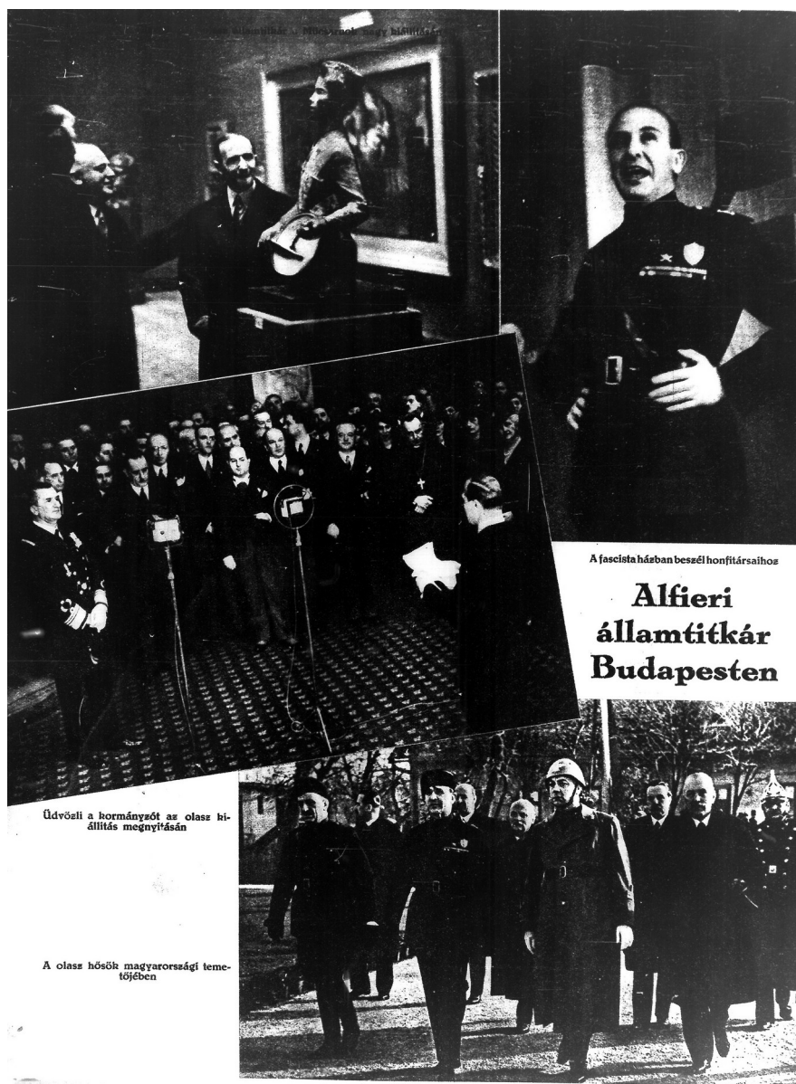
6. Alfieri államtitkár Budapesten (Il sottosegretario Dino Alfieri a Budapest), Nemzeti Magazin (Gazzetta della Nazione), 2 febbraio 1936

È innegabile che la mostra fu il culmine di una politica culturale che voleva dimostrare il cosmopolitismo dell'arte italiana contemporanea. Senza gli sforzi di Gerevich e dei borsisti a lui fedeli, l'Esposizione non avrebbe raggiunto questo scopo, ed è per questo che fu probabilmente l'evento più significativo dell'anno per quanto concerne i rapporti culturali italo-ungheresi. Tuttavia, per poter verificare questa teoria servirebbero maggiori ricerche e studi su eventi culturali simili che hanno avuto luogo nei paesi dell'Europa centro-orientale.