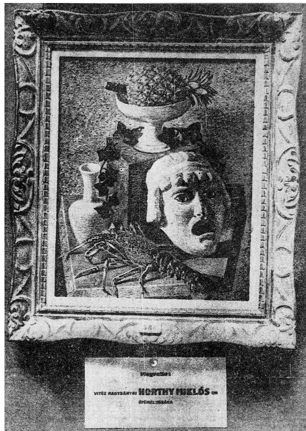
4. Csendélet. Gino Severini olasz festő képe... (Natura morta. Il dipinto del pittore italiano Gino Severini... ), Az Est (La Notte), 3 marzo 1936, pag. 10.

Distinguendosi da Jajczay, da Genthon e da Jenő Kopp, lo studioso Zoltán Nagy ebbe dei giudizi completamente diversi. Storico dell'arte, archeologo, e sostenitore delle idee di Tibor Gerevich, egli fu l'ultimo della sua generazione ad aver approfondito minuziosamente l'arte moderna italiana. 25 Nella sua recensione scritta sull'Esposizione per il giornale cattolico ungherese Uj Kor egli considerò Casorati il portabandiera del realismo magico, mentre scorgeva nelle raffigurazioni umane di Sironi la rappresentazione di una forza vitale prorompente. Similmente ai suoi colleghi utilizzò termini come artista redento per Carlo Carrà e soprattutto per Gino Severini, nella cui pittura sacra Zoltán Nagy forse fu l'unico ad evidenziare l'espressione di un linguaggio visuale contemporaneo ed antico allo stesso momento. Fra i pittori più giovani, Massimo Campigli fu considerato dallo storico dell'arte come un astro nascente, di cui lodò la capacità di combinare le influenze dell'arte parigina con l'arcaismo degli affreschi sui sarcofagi di al-Fayyum. 26