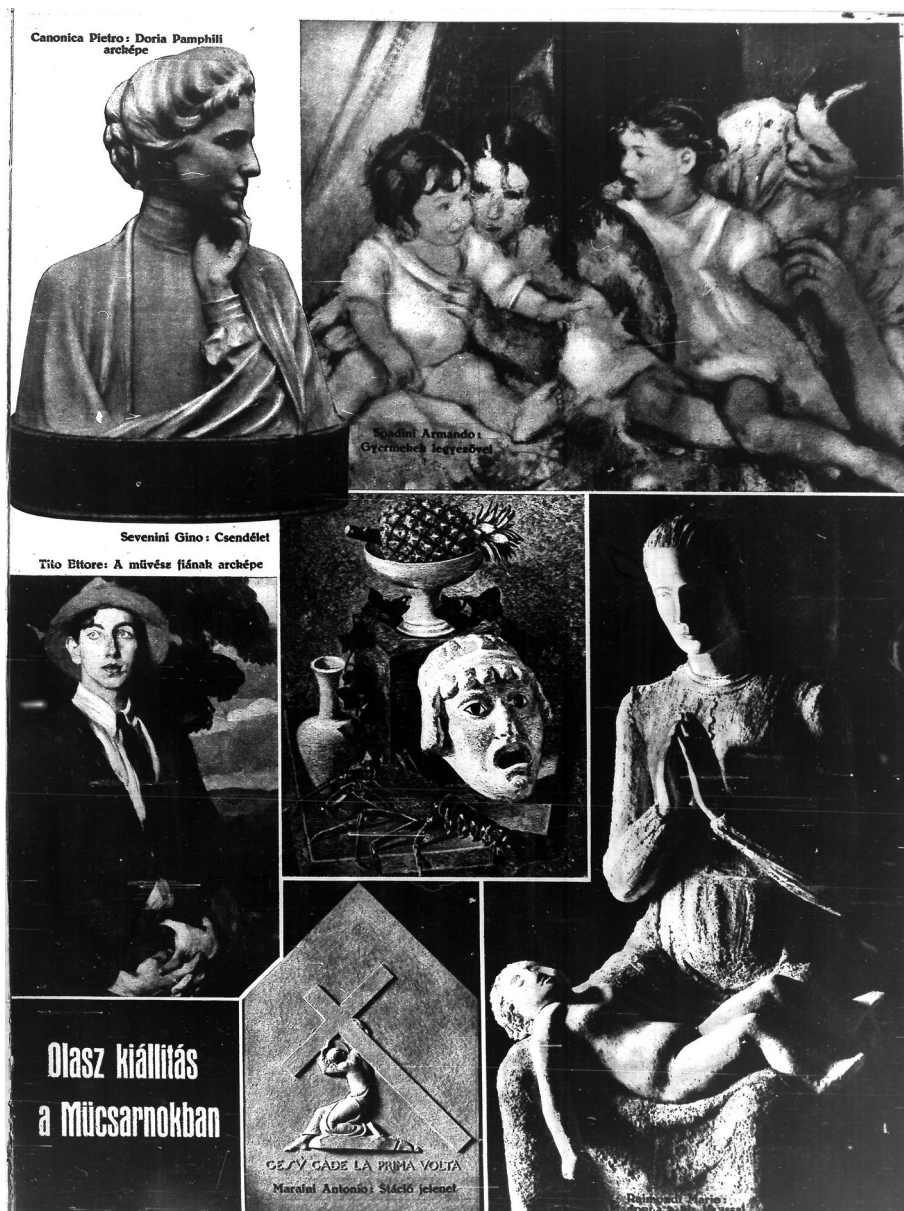
5. Olasz kiállítás a Múcsarnokban (Esposizione Italiana nel Múcsarnok), Nemzeti Magazin (Gazzetta della Nazione), 26 gennaio 1936

L'Istituto spese una parte del bilancio museale per acquistare l' Autoritratto di Carlo Carrà, 35 I pomodori di Felice Casorati, 36 La venditrice di ciliegie di Libero Andreotti, 37 quattro litografie ed un disegno di Renata Cuneo. Invece Il ritratto della Signora Severini di Gino Severini, fu donato dallo