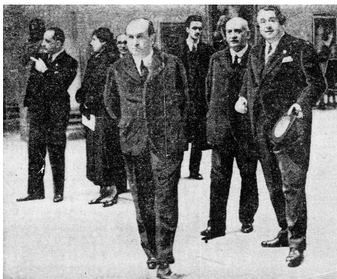
3. Gömbös Gyula miniszterelnök szombaton délben meglátogatta az olasz művészeti kiállítást... (- Il Presidente del Consiglio Gyula Gömbös visitò durante il sabato mattina la mostra d'arte italiana ... ), Az Est (La Notte) , 3 marzo 1936, pag. 10.