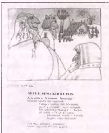
József Attila: Betlehemi királyok (Horváth Mátyas: Libben a hinta )

Ha a későbbi évfolyamokon visszatérünk a Betlehemi királyok hoz, az interpretációba társművészeti párhuzamokat is bevonhatunk. Vizuális illusztráció segítségével néhány példán – Pisano: Háromkirályok imádása , Bruegel, Leonardo és Botticelli: Királyok imádása című festményein (Sulinet Digitális Tudásbázis) – megmutathatjuk a diákoknak a bibliai témák továbbélését a művészetekben.