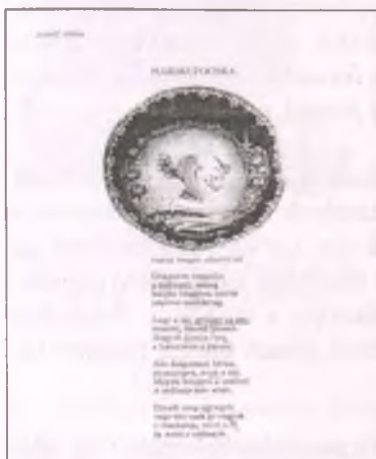
József Attila: Harmatocska (Sátai Pál: Olvasókönyv az ált. iskolák 6. osztálya számára )

Hetedik osztályban kerül sor a költő korai versének, a Télnek az értelmezésére. Ezt a verset a Szép szó mesterei című fejezetbe illesztette a tankönyvíró, és Alfred Wols német származású absztrakt expeszcionista festő Kompozíció című akvarelljével illusztrálta. Mindkét művel írói életrajzot is közöl a tankönyv. A 10–14 éveseknél az irodalmi művek megközelítésénél bevehetjük az elemzési szempontok közé a mű grammatikai, akusztikai és képi rétegének vizsgálatát is (BOROSNÉ, 1998, 676). A tanterv a hatodik és hetedik osztályra az oktatói-nevelői munka részfeladataiként arra utasít, hogy a műelemzés során a tanulóknál alakítsuk ki „az önálló véle-