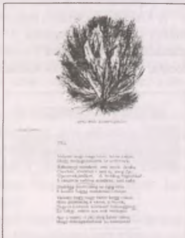
József Attila: Tél (Varga Zoltán: Olvasókönyv az ált. iskolák 7. osztálya számára )

A gimnáziumok és szakközépiskolák tantervében az irodalomtörténeti jellegű irodalomoktatásból kifolyólag a III. évfolyamon a Modernizmus és avantgard a két világháború között című tematikus egységben helyezkedik el a József Attila-anyag. Ezen az évfolyamon fejeződik be a József Attila-kép kialakítása, az életmű szintézise. Mindkét iskolatípusban ugyanazt a Bori Imre által írt olvasókönyvet használják (első kiadását 1989-ben engedélyezte a Vajdaság SZAT Oktatásügyi Tanácsa), ami kiegészül ugyanezen szerző Az irodalom története a középiskolák 3 és 4. osztálya számára című kötetével. Az általános és a természettudományi gimnáziumok esetében a tanterv által előírt kötelezően feldolgozandó költemény a Tiszta szívvel , a Klárások , A város peremén , az Elégia , az Óda és a Flóra , a társadalmi nyelvű gimnázium tanterve követelményként előírja a Téli éjszaka , a Reménytelenül