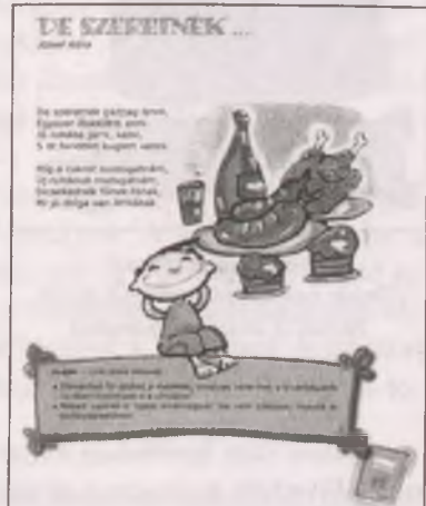
József Attila: De szeretnék... (Erdély Lenke: Olvasókönyv az általános iskolák 2. osztálya számára )

Iskolai tanulmányaik folyamán József Attila költészetével a diákok először az általános iskola második osztályában találkoznak. Az alsós évfolyamokon modern szemléletű, változatos feladattípusokkal és színes illusztrációkkal ellátott olvasókönyveket használnak a tanítók. Az általános iskola alsó négy osztályában a magyarázó olvasás eljárással tanítják az irodalmat, ezért a versek feldolgozása is ehhez a módszerhez igazodik. A tanulóknak el kell sajátítaniuk az olvasás technikáját, és megérteniük az elolvasott szövegeket. „A művészi megformáltság jelenségeire eleinte nemigen fordítanak figyelmet, de később is – a harmadik osztály második felében és a negyedik osztályban – elsődlegesen a történetre, az eseményekre koncentrálnak, és az így feltáruló érzelmi-hangulati hatásokra, továbbá a műforma legpregnansabb megnyilvánulásaira (a vers és próza különbözősége, néhány tipikus műfaji jellegzetesség, a ritmus és a