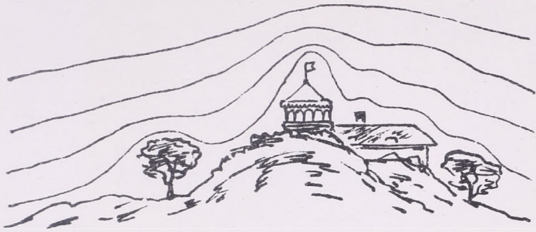
1. ábra. Földi tárgyak által megzavart niveau-felületek.