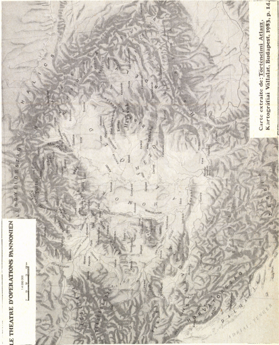
Carte extraite de: Történelmi Atlasz, Kartográfiai Vállalat, Budapest, 1983, p. 14.