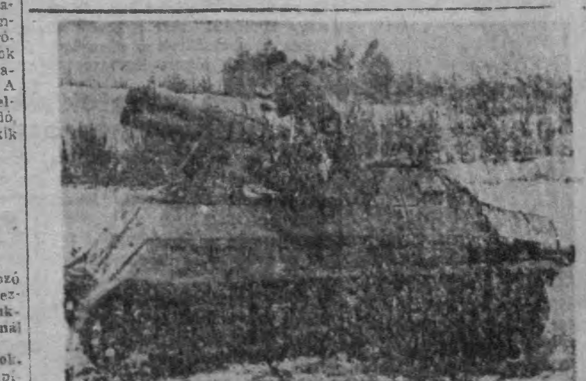
Német küldető a keleti front egyik szakaszán

Mitők használják állandóan megelőzésre a Darmol-t azért mert megbízhatóság és teljesen fájdalom nélkül hat leggyorsabb és legelkeredőbb csoklócsés használja a