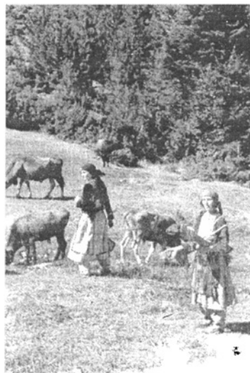
Az állatok országútján

Az egész fennsíknak 3 forrása van. Ezek közül az egyik nem messze a Shrelától, tehát a településtől eléggé távol, a másik pedig a mi táborhelyünk mellett van. A vizet mindenki ettől a két forrástól, nagyjából azonban a felsőtől hordják, amely mellett mi is letelepedtünk. Ezt a munkát természetesen az asszonyok végzik. Jönnek egyenként, kettesével, hármával, kezükben fonóléc, hátukon a kis 8-10 literes vizeshordó. Kimossák, megtöltik a hordót, elbeszélgetnek egy kicsit, kecskeszorból font kötéllel ügyesen a hátukra kötik a hordót, s indulnak vissza.