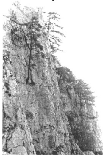
A „Toldi-kapu” előtti sziklafal