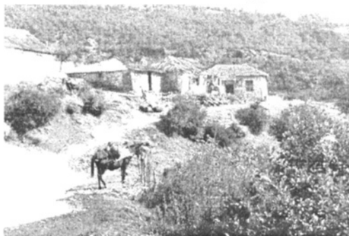
Shën Pali, a hegyi falu