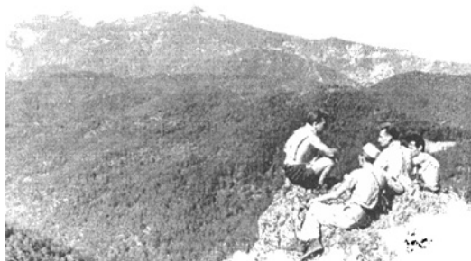
A Fani Vogel óriása, a Munella

Végre találtunk egy ösvényt, amely látszólag Shën Gjini felé tart el. Belekeveredtünk a még borzalmasabb tebrek sorozatába. Közben nemegyszer el is veszítettük az utat. Végül már egyáltalán nem érdekelt bennünket Shën Gjini, csak ép bakancsokkal ússzuk meg ezt a vállalkozást.