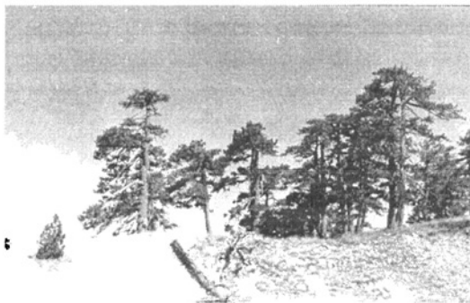
P leucodermis erdő 1900 m magason

Utunk egyébként amellet, hogy kellemes, szép is volt. Szép bükkösökön vitt keresztül, majd felfelé mind több és több gyönyörű Pinus leucodermissal találkoztunk. A nyeregnek is az a fő érdekessége, hogy benne 1900 m magasságban valóságos Pinus leucodermis erdő van. Ezek a törzsek azonban mind olyanok, mint a megrokkant óriások: törzsük 60-80 cm átmérőjű, magasságuk azonban nem éri el a 8-10 m-t, koronájuk pedig megtépázottan szétlapul.