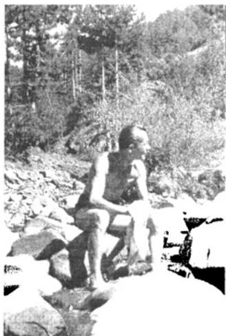
A tábori élet örömei

általában a völgy középső szakaszát Kukës-sal köti össze. Így eléggé forgalmas útvonal. Naponta legalább 4-5 gyalogos vagy öszvéres elhalad rajta Kukës felé, vagy onnan jövet. Az erremenők persze a mi tűzünkél mind megpihennek. A múltkor este két öszvéres táborozott itt le. Az öszvéreket kipányválták, maguk pedig lefeküdtek a mi tűzünk mellé. Majdnem egész éjjel beszélgettek, s az összes begyűjtött száraz fánkat eltűzelték.