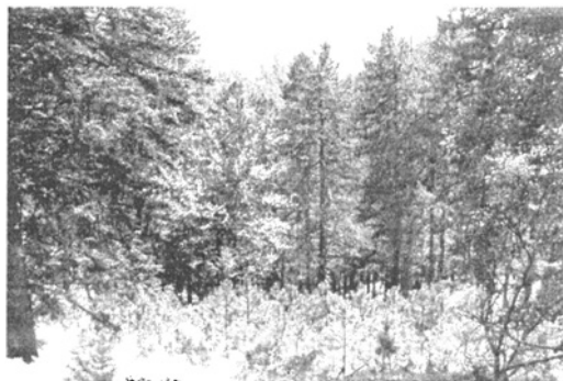
Kefesűrű feketefenyő újulat