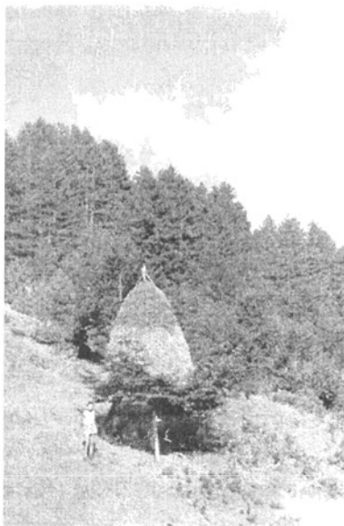
Szénaboglya a fa tetején

Eddig alapjában véve jól érzem magam. Nem vagyok fáradt, semmi bajomat nem érzem. Egy izgat csak. Tegnap az alsó talp már mindkét bakancsomon elkopott, sarka már jóformán egyáltalán nincs. Hogy bírom ki ezen a terepen ilyen bakancscsal a még hátralevő három hetet? Egyébként a többieknek a bakancsából is a szögek, még a frissen vertek is, mind kihullottak. Rémesek ezek a köves, sziklás utak, ereszkedők. Még az a szerencse, hogy a lábamnak semmi baja. Valahogy majd csak lesz. Legfeljebb a tábort fogom őrizni.