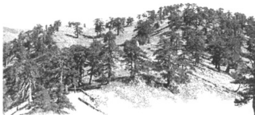
A Maja e Zebes teteje (1987 m)

Nagyon érdekes látvány volt. Ilyet még sem Kárpátalján, sem Erdélyben nem láttam. Ott a hegyek 1700-1800 m felett általában már teljesen kopaszok, sziklásak, vagy havasi legelő van rajtuk. Itt pedig még 1900 m magasságban, sőt feljebb, a Zebes 2000 m-es csúcsa felé vivő gerinc taréján is elég szép számmal láthattunk fenyőt. Nemcsak a havasi régióra jellemző csökevényes, bozotos Pinus montanát , hanem a magastörzsű Pinus leucodermis gyönyörű egyedeit is. Egyébként a Maja e Runës-szal szemben itt a Pinus montanát is megtaláltuk, a Juniperus nana -val együtt, viszont itt nincs vörös áfonya, ami a Runëst különösen széppé teszi. A tetőn kaszáló van. Érdekes volt 2000 m magasan szénaboglyákat látni.