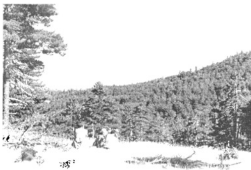
A Ćafa e Komitban

rendkívül kellemes volt, nem volt bántó hőség.