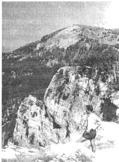
A Guri-i-Nusses bűvöletében