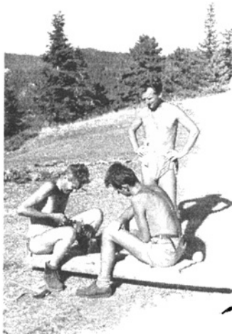
A „kepuçar”, susztermühely

általában a völgy középső szakaszát Kukës-sal köti össze. Így eléggé forgalmas útvonal. Naponta legalább 4-5 gyalogos vagy öszvéres elhalad rajta Kukës felé, vagy onnan jövet. Az erremenők persze a mi tűzünkél mind megpihennek. A múltkor este két öszvéres táborozott itt le. Az öszvéreket kipányválták, maguk pedig lefeküdtek a mi tűzünk mellé. Majdnem egész éjjel beszélgettek, s az összes begyűjtött száraz fánkat eltűzelték.