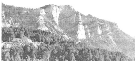
A Guri-i-Nusses félelmetes sziklafala

A Guri-i-Nusses szédületes 600 m magas, majdnem függőleges sziklafalával és alatta a Shën Gjini katlannal kettőbe vágott félhegynek látszik, amely előlről teljesen megközelíthetetlen, oldalról a Zebes gerincén át, és hátról azonban könnyen járható. Ez azonban csak látszat.