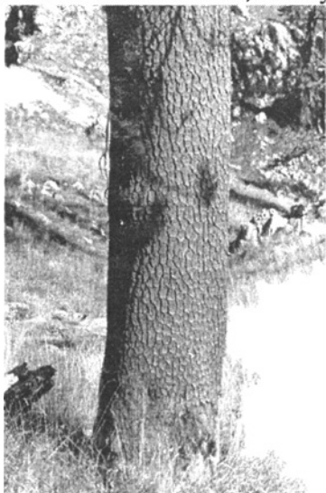
P. leucodermis jellegzetes pikkelyes kérge

Kárpótlásul az egész napi fáradságért egy nagy kiterjedésű földi szedresbe érkeztünk, amelyben fél óra alatt fejenként legalább 1 kg szedret megettünk. Sehol sem láttam még olyan nagy szemű szedret, mint ott. Nagyon jó volt, annál is inkább, mert megint víz és élelem nélkül voltunk.