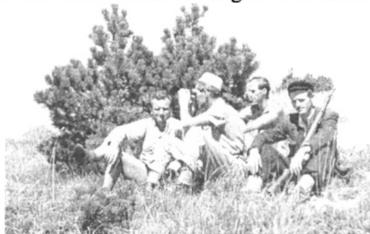
Pinus montana árnyékában

mindenség a lábaink alatt lenne. Az ember könnyűnek, felszabadultnak, ugyanakkor sem-minek érzi magát. Fenséges és csodálatos volt.