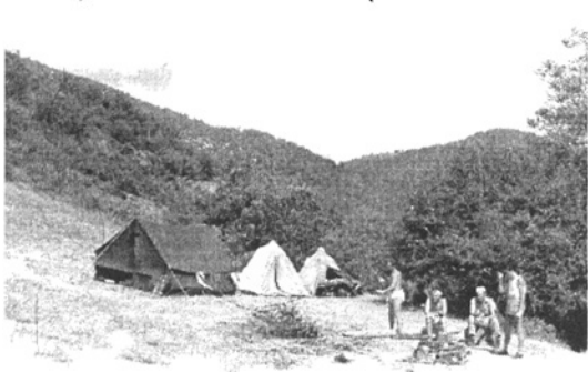
Első táborhelyünk Thirrë-nál (824 m)

A nyeregből felmáztunk a Kodra e Hekurit csúcsára (1450 m), s ott a fényképezéssel, báméskodással úgy eltöltöttük az időt, hogy nem vettük észre, amikor a karaván (3 muli + kísérők) a csúcs alatt egy másik nyereg, a