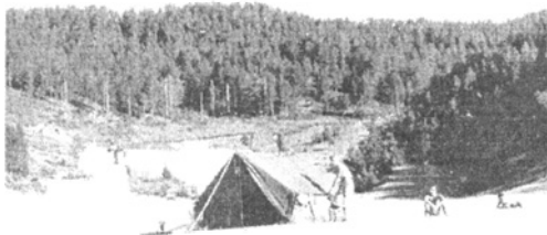
Második táborhelyünk Dundhesh-nél (1252 m)

Mégiscsak sikerült a költözés, minden zavar és nehézség nélkül. Az utolsó szakasz volt a legnehezebb, mert Bishza kb. 900 m-en, egy fennsíkon fekszik, a Dardha-i völgyfenék pedig, amelyből hirtelen emelkedővel 600 métert kellett felkapaszkodnunk, kb. 650 m-en van. Először azt hittem, hogy az öszvérek nem tudnak ide feljönni. S a végén ők majdnem jobban bírták, mint mi.