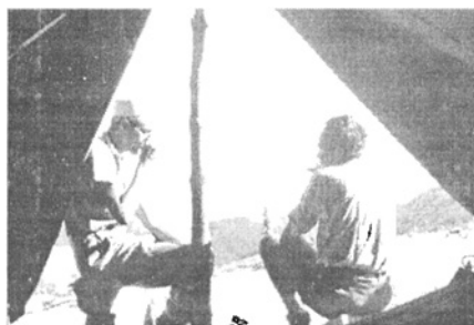
A tábori élet örömei: szertartásos kávézás

Ideérkezésünkkor nem árkoltuk körül a sátrat, mert azt reméltük, úgyis szép időnk lesz, mint Dundheshben. Napok óta növekszik azonban az izgalom, hogy mikor fog bennünket kiönteni az eső. Egyik éjjel jó darabig nem is tudtam elaludni az ezzel kapcsolatos izgalomtól. Lefekvés után