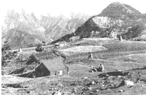
Harmadik táborhelyünk Neusheit-nél (1247 m)