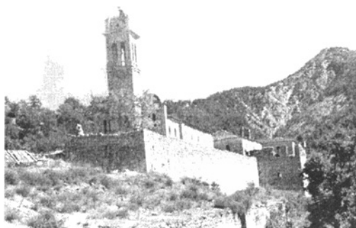
Az Orosi kolostor

Ma leszálltunk a hegyekből és átjöttünk ide, SHËN PALI-ba, hogy innen holnap, szeptember 8-án gépkocsival beköltözzünk Tiranába. Lefelé