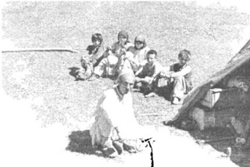
A hegyi népek országútján

Félelmetesen szép volt. Az átkelés, a tulajdonképpeni „kapu” alig két méter széles. A külső, meredek fal felőli kapufélfa egy legalább 8-10 m magas, szilárdan álló szikla; a másik pedig egy a hegyoldalból félig levált, ferdén a kapu fölé hajló, kb. 200 tonnás sziklatömb. A kapun túl, jobbról egészen közelinek látszik a Munella. Elöl 60-80 m magas, függőleges sziklafal, oldalt alattunk kőfolyás és szédületes mélység.