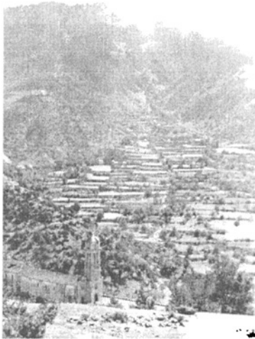
A Mali Shëntit, előtérben az Orosi kolostor

3-án rám került a sor a házörzésben. Nem hittem, hogy ezt az egész utat így megúszom. Thirrë-ban a Runës-i túra után meg voltam győződve róla, hogy a második héten kikészül a bakancsom, s attól kezdve kényyszerpihenő lesz a részem. Csak azért izgultam, hogy legalább a Zebes-i utat végig tudjam csinálni. Az igaz, hogy rémesen megrongálódott a bakancsom, mégis kényyszerpihenő nélkül átvészelttem az egészet, hála Istennek.