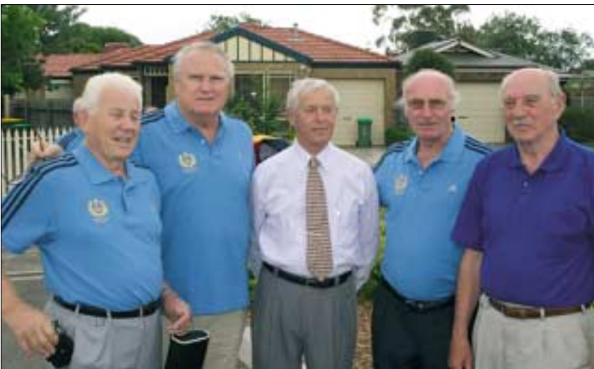
Tábory László olimpiai negyedik, négyszeres világsúcstartó középtávfutó, Zsivótzky Gyula olimpiai bajnok kalapácsvető, Varasdy Géza Európa-bajnok vágótűző, Kulcsár Gergely olimpiai ezüstérmes, kétszeres bronzérmes gerelyhajító és Dehény Ferenc, 1954-ben főiskolai világbajnok 3000 méteres akadályfutó