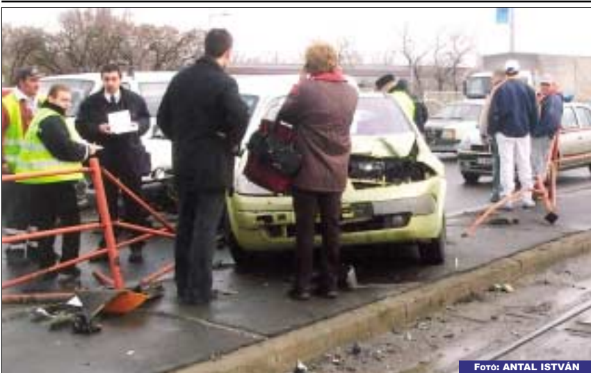
ÜTKÖZÉS AZ ÁRPÁD HÍDON. Három személygépkocsi ütközött február 9-én az Árpád híd budai hídfőjénél. Az egyik átszakította az úttestet a villamospályától elzáró korlátot és a padkán állt meg

1 % 1 % 1 % A kiemelkedően közhasznú Óbuda-Békásmegyer Polgárör Egyesület önkéntesei 1995 óta tevékenykednek azért, hogy a kerületben javuljon a közbiztonság helyzete. Ennek anyagi költségeit kizárólag a lakossági támogatásokból, vállalkozói adományokból, a személyi jövedelemadó 1 százalékából, illetve pályázatokból tudják fedezni. Az szja 1 százalékából 2006-ban 196 ezer 79 forint támogatást kaptak, amelyet teljes egészében működési költségekre fordítottak.