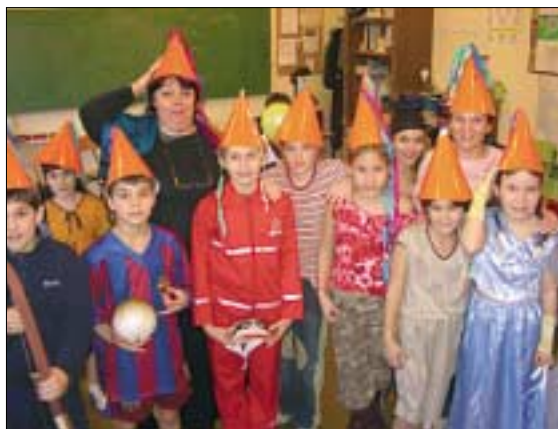
Farsangi mulatsággal zárták az iskolnapot február 2-án az alsó tagozatos diákok a Bárczi Géza Általános Iskolában

A szülők egészségügyi vizsgálatokon (magasság-, súly-, vérnyomás-, testzsír-mérés) és talpmérésen vehettek részt. Tudásukat és intelligenciájukat önismerteti és műveltségi vetélkedőkön bizonyították.