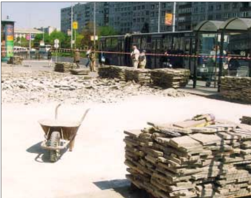
TÉRBURKOLAT-CSERE A FLÓRIÁN TÉREN. A Fővárosi Önkormányzat megbízásából felújítják a Flórián üzletközpont előtti, Szentendrei út felőli részen a térburkolatot

A kerületi történelem versenyen az ötödikes csapat I. helyezett lett.