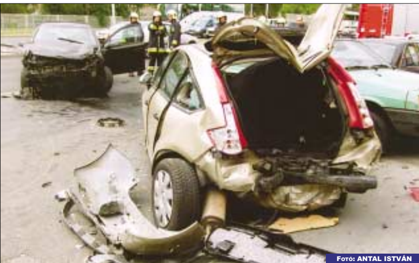
TOTÁLKÁR. Több autó ütközött egymásnak a Szentendrei úton július 5-én, vélhetően valamelyikük figyelmetlensége miatt

Két ismeretlen férfi egy Római téri italdiszkontba térve, fenyegetéssel a bevétel átadására kényszerítette az eladót még május 16-án 22 óra körül. A rendőrség keresi az elkövetőket. Mindkét férfi átlagos testalkatú, körülbelül 185 centiméter magas, 25 év körüli. Farmert és kapucnis pulóvert viseltek, az arcukat a szemüknél és szájuknál kivágott maszkkal takarták. A Budapesti Rendőr-főkapitányság munkatársai kérik, aki a fenti időpontban a bűncselekmény helyszínének közelében tartózkodott, vagy aki ismerheti őket, illetve az elkövetőkkel kapcsolatban érdemleges információval rendelkezik, hívja a 443-5000-es telefonszám 32-379-es mellékét, illetve névtelensége mellett tegyen bejelentést az ingyenes 06-80-555-111-es „Telefontanú” zöldszámán, vagy a 107-es, 112-es központi segélyhívó telefonszámok valamelyikén.