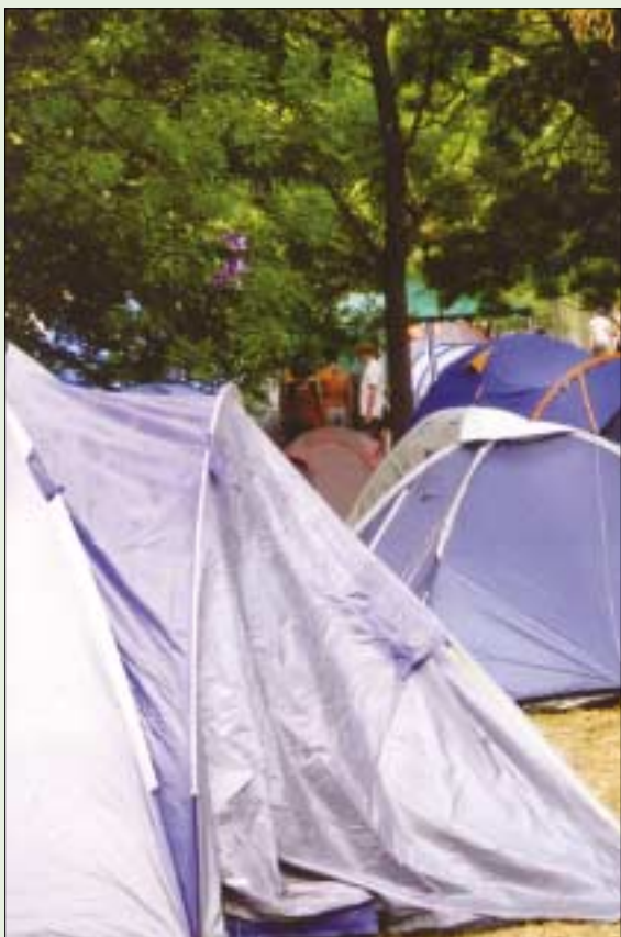
SÁTORLAKÓK. Mindenütt táborozók foglalták el sátrakkal a színpadok, előadóhelyek közötti területeket