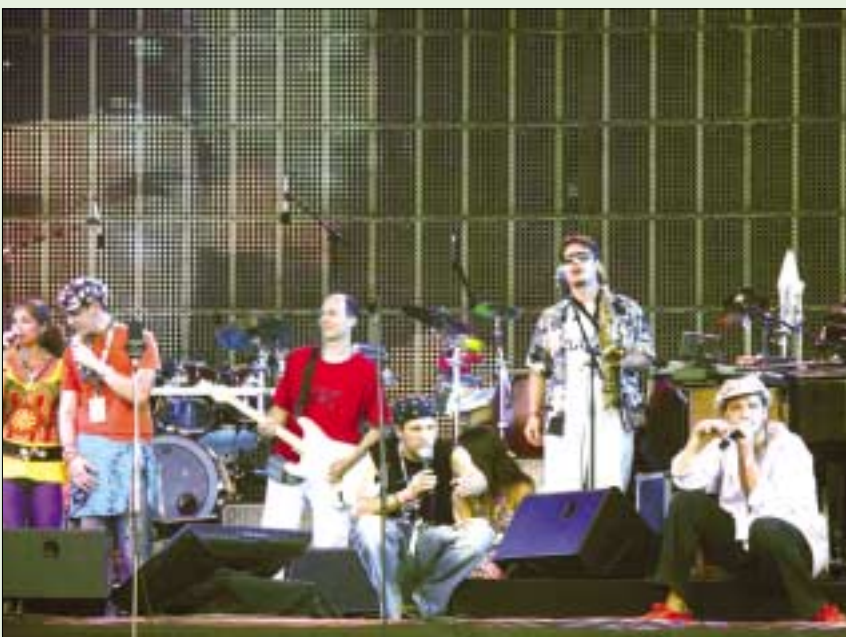
A „KÉPZELT RIPORTTAL...” NYITOTTAK. A megafesztivál úgynevezett „nulladik” napján a „Képzelt riport egy amerikai popfesztiválról” koncertváltozatát mutatták be nagy sikerrel neves előadók