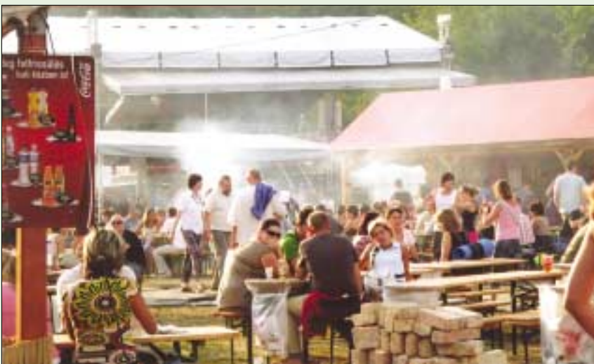
KULINÁRIS ÉLVEZETEK A SZIGETEN. A növekvő igényeknek megfelelően 62 vendéglátóhelyen nemzetközi konyhák kínálataiból, különlegességekből, vegetáriánus ételekből válogathattak a falatozni vágyók. Szomszédokat narancsfacsaró-árusoknál, 5 borozóban, 3 pálinkaházban, 65 valódi kocsmában, 7 kávézóban és 2 teázóban olthatták a látogatók