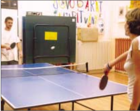
Nálunk tanulhatsz, interezhetsz, kézművesked-

Megtalálsz minket a Pethe Ferenc tér 1-3. szám alatt, Kaszásdűlőn, a HÉV-megállótól 2 percre. A felújított tér felől gyere, vagy kerüld meg az épületet és keresd az Éjféle sportbajnokság, vagy a Jövőbarát Alapítvány feliratot!