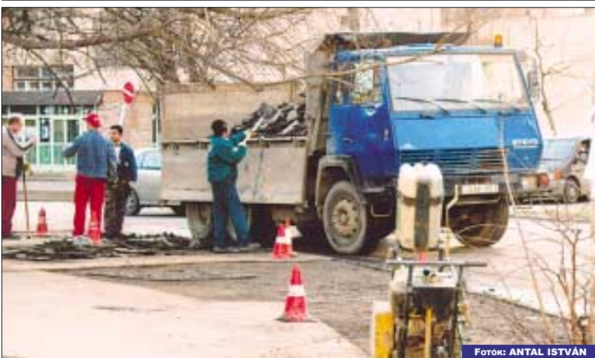
A január végi fagymentes napokat kihasználva, járdát javítottak a Zapor utcában az Ambíció Kft. dolgozói