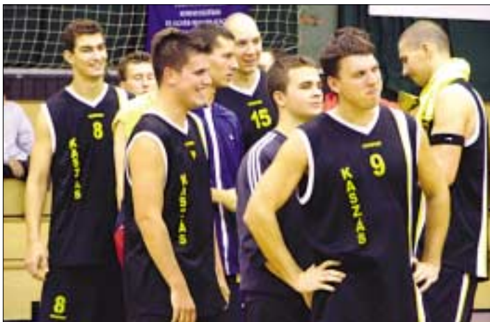
Jogos az öröm: remek eredménnyel került rájátszásba a felnőtt csapat