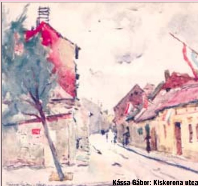
Kassai Gábor: Kiskorona utca