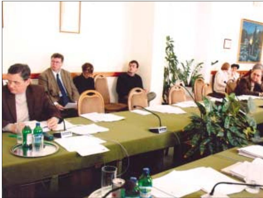
Az MSZP-frakció képviselői egyéb elfoglaltságuk miatt nem vettek részt a testületi ülésen

A továbbiakban 29 igen és 1 ellenszavazat mellett jóváhagyták a Remetehegyi út-Nyereg utca-Haránt utca-az erdő határvonala és a Remete köz által határolt terület Kerületi Szabályozási Tervét, majd ugyanilyen arányú voksokkal módosították a Remetehegyi út és Bécsi út környéke Fővárosi Szabályozási Keretét. Egy jóváhagyás és egy