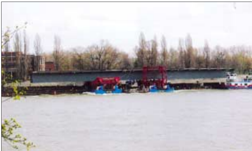
Hídelemet úsztatnak a Dunán

Az 1870 méter hosszúságú Megyeri híd hosszában öt, szelvényben pedig két hídszerkezetből áll. Ezek közül a budai oldalon lévő ártéri, a Szentendrei-sziget fölötti és a pesti oldalon a 2-es számú út fölött húzódó vasbeton hidak szerkezetépítése február vé-