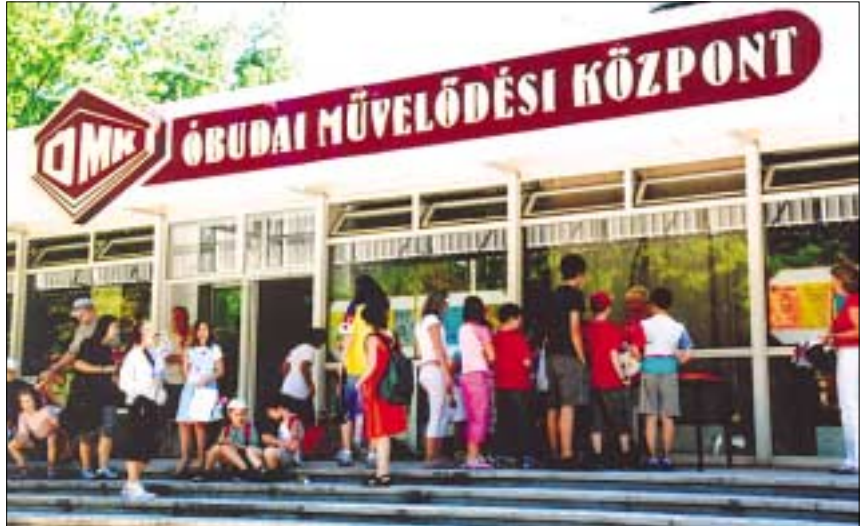
A felirat a régi, de az Óbudai Kulturális Központ szellemisége megújult, programjai még színvonalasabbnak, színesebbnak ígérkeznek

- Az Óbudai Kulturális Központban (OKK) a San Marco Színpad színházi előadásokkal, koncertekkel nyújt tartalmas kikapcsolódást valamennyi korosztálynak. Szeptember végétől minden vasárnap délelőtt bábszínházzal, gyermekszínházi előadásokkal, koncertekkel, mesedelelőttökkel, játszóházzal várjuk a családokat.