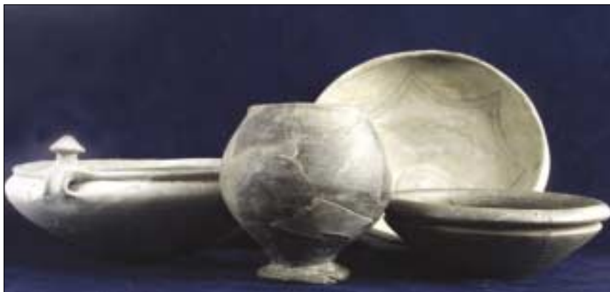
Kelta edények az Aquincumi Múzeum új, időszak kiállításán