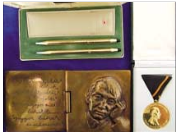
A zsákmány egy része előkerült

A panelépületekben sok helyütt látni, hogy a folyosókat ráccsal zárják le a lakók. Az ezeken található zárat ugyanúgy, egy mozdulattal el lehet törni. Ennél sokkal jobb megoldás lenne, ha az ajtókon lévő zárat egyesével védene egy speciális kör alakú cilinderral, mely olyan széles, hogy a hengerzár külső síkjáig védi a zárat. Ezt célszerű kapupánt csavarral rögzíteni, hogy kívülről ne lehessen leszerelni. A lényeg, hogy a betörők ne tudjanak rajta fogást találni. Úgy követik el ugyanis a zártörést, hogy ahol az ajtó síkjából kiáll a zár, azt akár egy svédfogóval eltörik, majd benyúlnak egy csavarhúzóval, és az így szabadon maradt zárbetét elfordítják és az ajtó már nyitható is. Ez két határozott, erős mozdulattal elvégezhető.