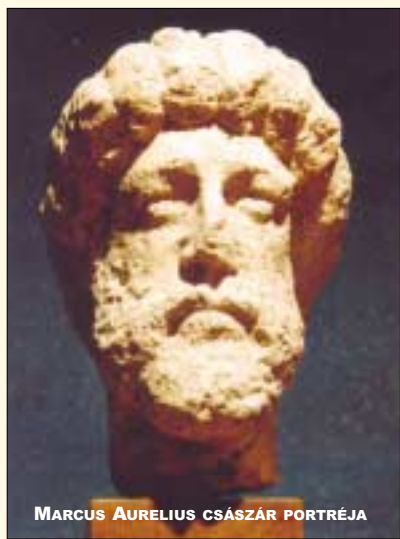
MARCUS AURELIUS CSÁSZÁR PORTRÉJA

Az Aquincumi Múzeum gyűjteményének legszebb darabjai. Időszaki kiállítás-sorozat 2009. szeptember 20-ig. (Helyszín: Aquincumi Múzeum, kiállítási épület.)