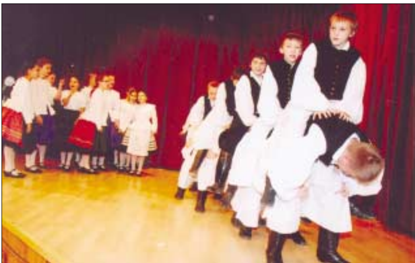
A gyermektáncosok nagy sikerű műsort adtak a nagycsaládosok karácsonyán, tavaly december 14-én az Óbudai Kulturális Központ-Békásmegyeri Közösségi Házban

A Kincső Együttes tavaly is többször tett eleget annak a megtisztelő felkérésnek, hogy a Hagyományok Háza színpadán az Állami Népi Együttest helyettesítse.