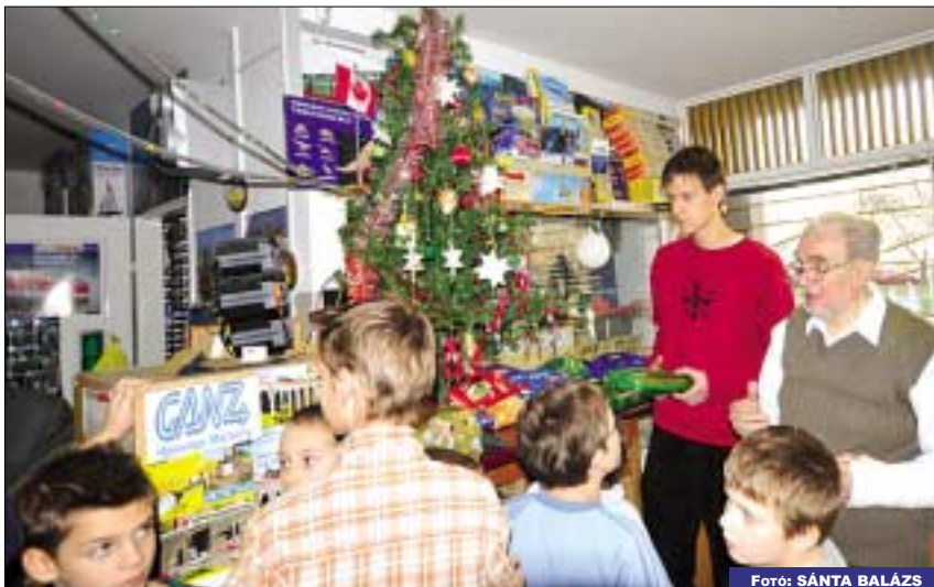
Együtt ünnepeltek karácsonykor a gyermekek Bús Balázs polgármesterrel a Ganz Ifjúsági Műhelyben

Az óbudai székhelyű Budapesti Műszaki Főiskola (BMF) fűtőt keres. (Érdeklődni a 666-5652-es telefonszámon lehet. Cím: Bécsi út 96/b.)