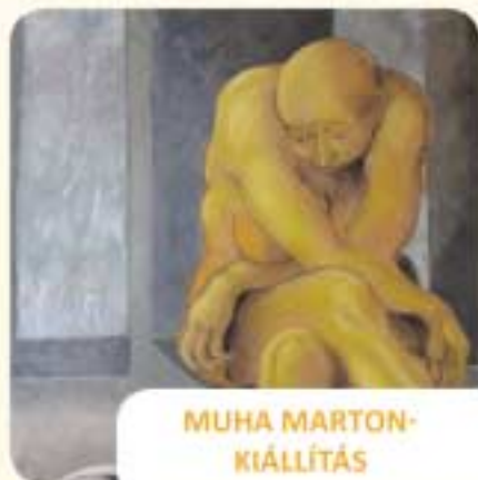
MUHA MARTON- KIÁLLÍTÁS

A színdarab Keresztes Krisztof ferenccs rendi atya és rendfőnök szenvedéstörténetéről szól. Őt a rend vezetősége az 1941-es visszacsatolás után Székesfehérvárról Újvidékre költöztette, hogy az ottani rendházat vezesse. Az újabb impériumváltáskor Krisztof, bár sejtli, hogy mi következik, és lenne lehetősége a menekülésre, mégis úgy dönt, hogy az elkövetkező vérzivataros időkben sorsközösséget vállal a délvidéki magyarsággal, a híveivel, és állomáshelyén helyben marad. (Jegyár: 2.000 Ft)