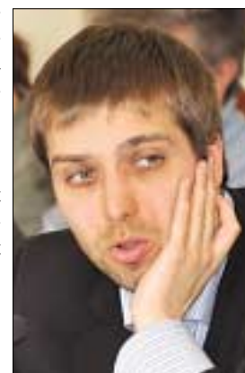
FOLYTATÁS AZ 5. OLDALON