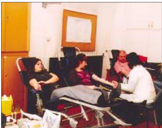
Önkormányzati dolgozók adtak vért január 29-én a képviselő-testületi irodában

A véradás ideje alatt in-gyenes látásvizsgálat is lesz. Ha ön egészséges, elmúlt már 18 éves, de még nem töltötte be a 60. életévét és úgy érzi, hogy segíteni tud a rászoruló betegeknek, jöjjön el a véradásra! Személyi igazolvány (lakcímkártya) és taj-kártya szükséges.