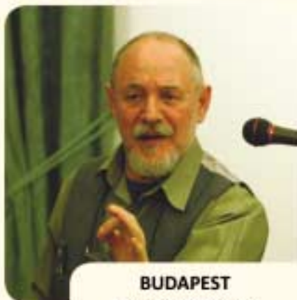
BUDAPEST RAGTIME BAND