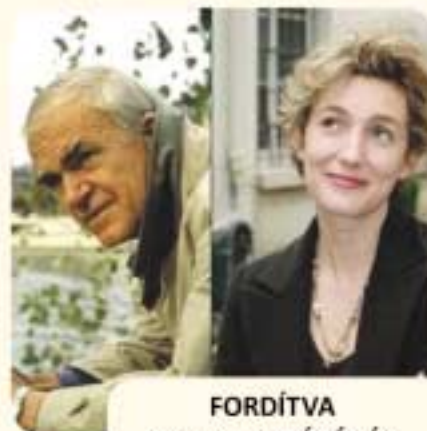
FORDÍTVÁ IRODALMI KÁVÉHÁZ