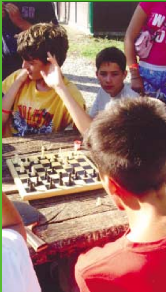
Pillanatképek a Balatonszabadi-Sóstói Gyermektáborból