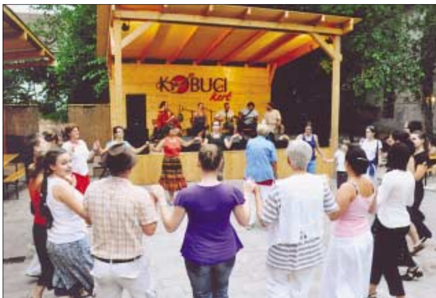
Felvételünk az egyik táncmuzsika programon készült augusztus 6-án

A Kobuci kert első ízben 2005 nyarán, a Kapolcsi Művészetek Völgye Fesztiválon nyitotta meg kapuit. Színvonalas népzenei programjai mellett különleges étel és ital kínálatával nyerte el a közönség tetszését. A Kobuci kert története idén nyáron Óbudán, a Zichy-kastély kertjében folytatódik, szeptember végéig-október elejéig.