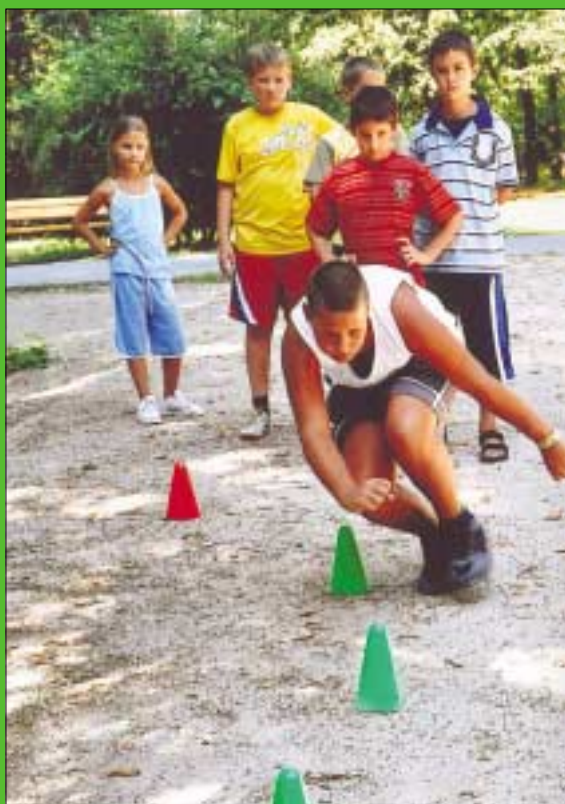
A Keve-Kiserdei Napközi táborban sportprogramokkal, kézműves foglalkozásokkal várták a diákokat. A forró napokon heti több alkalommal fürdőzhetnek a Pünkösdfürdői Strandon