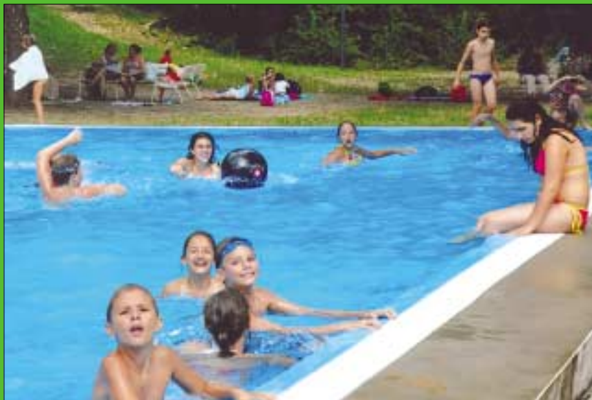
A Laborc utcai Barátság Szabadidő Centrumban lévő táborban a medencében pancsolás mellett számos program közül választhatnak a gyerekek, a nagy melegben azonban minden bizonnyal ez volt a legnépszerűbb elfoglaltságuk