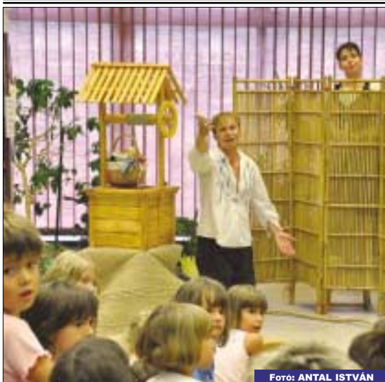
A Batyu Színház előadásában, „A szegény ember gazdagsága” címmel láthattak népi játékokat a gyerekek augusztus 10-én a békásmegyeri könyvtárban, a Szüniidő programban

www.magyarrajzfilm.hu/gyermeoktatasi.html )