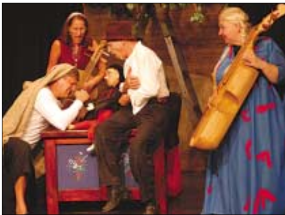
A színészek a „Pinkó az ördög fia” című darabot próbálják

Évente átlagosan 250 alkalommal találkozunk közönséggel és ezek színhelye kétharmad részben Óbuda. Amennyire erőnköbül telik, járjuk az országot és a határon túli magyarlakta vidékeket. Legutóbb például Szovátán játszottunk az Égig Erő Fesztiválon nagy sikerrel, amit az is jelez, hogy meghívtak bennünket a parajdi sóbányába, Erdély legnagyobb karácsonyi ünnepére, ahol több ezer gyermeknek adhatjuk elő majd az Óbudán már 23 év óta adventről ad-