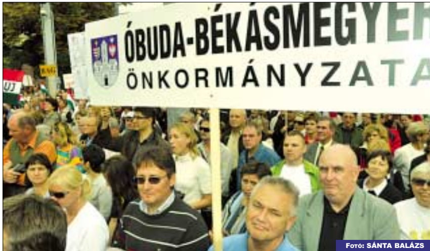
Több ezren demonstráltak a Kossuth téren október 10-én a fideszes önkormányzati vezetők kezdeményezésére, a helyhatóságokat sújtó, a kormányzat által 2010-ben kezdeményezett lépések ellen

ki Magyarországon, sok gyermek nem jut hozzá a szükséges élelmiszerhez.