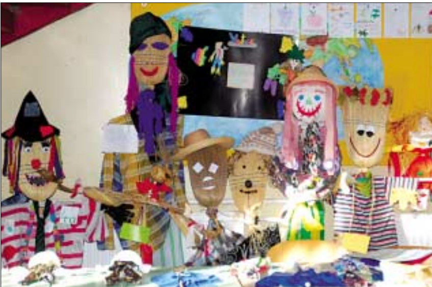
Tanulók alkotásai: madárijesztők az iskola falán

A Paisban újdonságnak számít a „Mosoly rend” létrehozása. Azok lehetnek tagjai, akik az adott hónapban a legtöbbet tettek osztályukért, iskolájukért. Itt az egyéni képességek dominálnak, az a lényeg, hogy a tanulók a bennük rejlő tudást aktívan és ön-