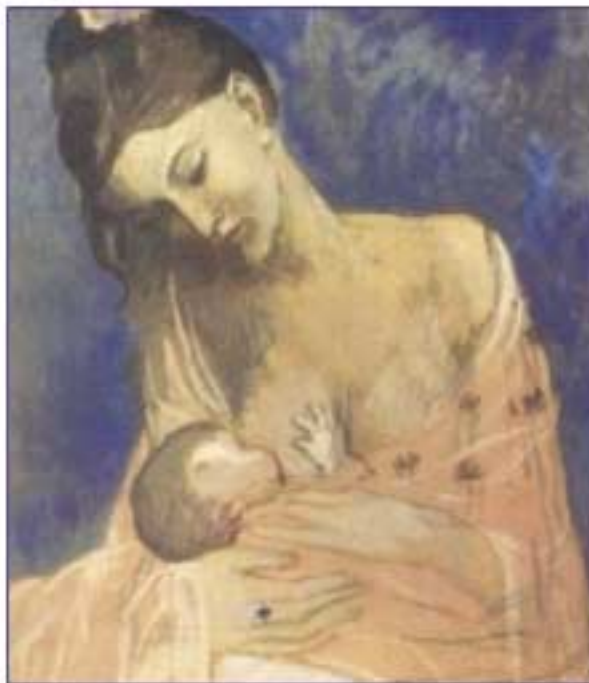
Picasso Szojtatás c. festménye

Helyszín Békásmegyeri Községi Ház (III. Csobánka tér 5.)