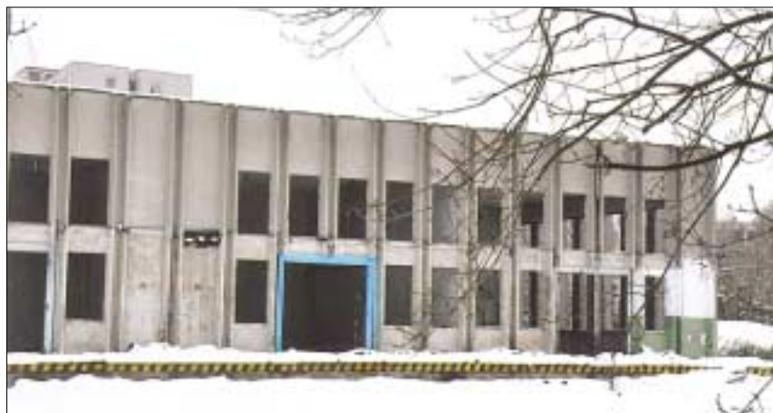
A Huszti út végén, egy bontás előtt álló nyomdaépület helyén épül fel az Aldi élelmiszer áruház

lekedési szakhatóság az engedélyezési eljárásban nem tett olyan kikötést, amely a Zab utca forgalmát módosítaná. A beruházáshoz kapcsolódó közlekedésfejlesztésre a Fővárosi Önkormányzat közlekedési ügyosztálya adott engedélyt, melynek értelmében az Aldi a Huszti út sarkához közel, de a Zab utca felől közelíthető meg.