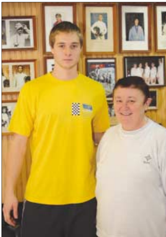
Szívesen foglalkozik fiatalokkal az olimpiai bajnok

Hosszan lehetne sorolni sikerei jelentős állomásait, csak néhányat említünk meg közülük: az első jelentős teljesítmény 1971-ben junior vb első hely, majd a bécsi felnőtt vb-n