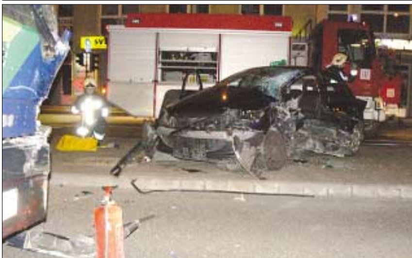
ÉJFÉLI KARAMBOL. A Nagyszombat-Lajos utca kereszteződésében BKV autóbusz ütközött személygépkocsival június 5-én, nem sokkal éjjel után. A Peugeot sérült vezetőjét hidraulikus felszívó-vágó segítségével szabadították ki a tűzoltók. A buszon utazóknak nem történt bajuk

Egy 15 emeletes lakóház földszintjén, egészen pontosan a ház bejárata előtt összehordott hulladék kapott lángra június 18-án hajnalban a Margitliget utcában. A tűzoltók egy sugárral oltották el a tüzet, a házat pedig átszellőztették. Személyi sérülés nem történt. Mivel a tűz keletkezése kapcsán felmerült a szándékosság gyanúja, ezért a rendőrség munkatársai és a tűzvizsgálók is a helyszínre érkeztek.