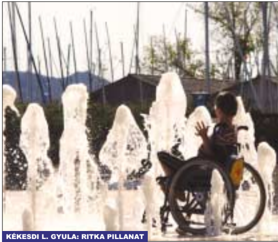
KÉKESDI L. GYULA: RITKA PILLANAT

A fennállásának 20. évfordulóját ünneplő Gézengúz Alapítvány célja az volt a pályázattal, hogy bemutassa a sérült és egészséges