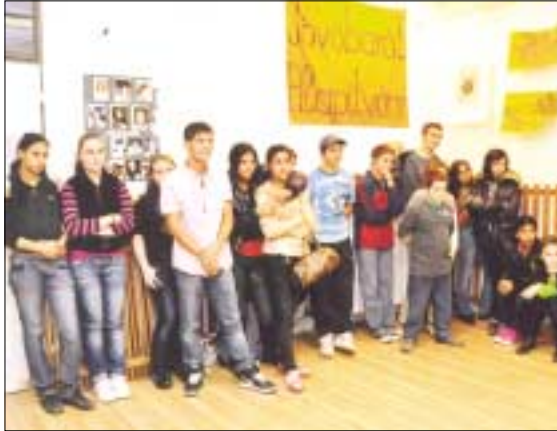
A táboroztatást záró rendezvényt november 5-én tartották a Jövőbarát Alapítvány Pethe Ferenc téri székhelyén