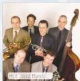
Hot Jazz Band

ingyenes korcsolyapálya – korcsolyabérlési lehetőséggel hagyományőrző kézműves vásár | életnagyságú betlehem | ünnepi falatok és forró italok