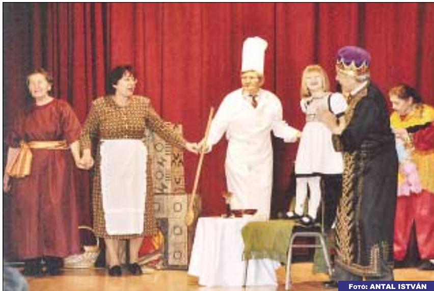
A Kiskorona utcai idősek klubjának színjátszó csoportja Móra Ferenc: A didergő király című mesejátékát adta elő nagy sikerrel

di összeállítások, népdalok, slágerek, vidám jelenetek váltották egymást. A fesztiválon az Óbudai Gondozási Központ klubtagjai és nem klubtagok egyaránt lehetőséget kaptak a bemutatkozásra.