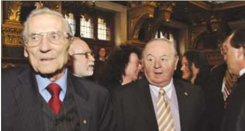
Grosics Gyula és Kárpáti György

Tarlós István beszédében felidézte az 1872 decemberében kiadott egyesítési törvényt, majd a fővárosi tanács egy évvel későbbi megalapítását is; a főpolgármester pár-