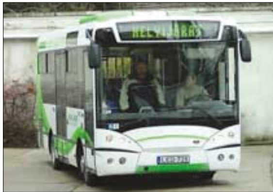
A képen látható midibusz típusazonos, de nem a BKV színére festett

Korszerű, alacsonypadlós, EURO V-ös besorolású, légkondicionáló berendezéssel ellátott kisbuszokat kap a III. kerület. A Molitus midibusz S91-esek a jelenleg közlekedő, 16 éves Ikarus 405-ös típusú midibuszokat, a BKV legtöbbször meghibásodó és fajlagosan legdrágábban üzemeltethető busztípusát váltják fel.