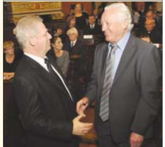
Tarlós István és Albert Flórián

huzamot vont az első polgári és a mostani városvezetés között, s megjegyezte, hogy súlyos örökséget kaptak - főként a BKV és a 4-es metró helyzetét tekintve. Budapestnek minden magyar fővá-