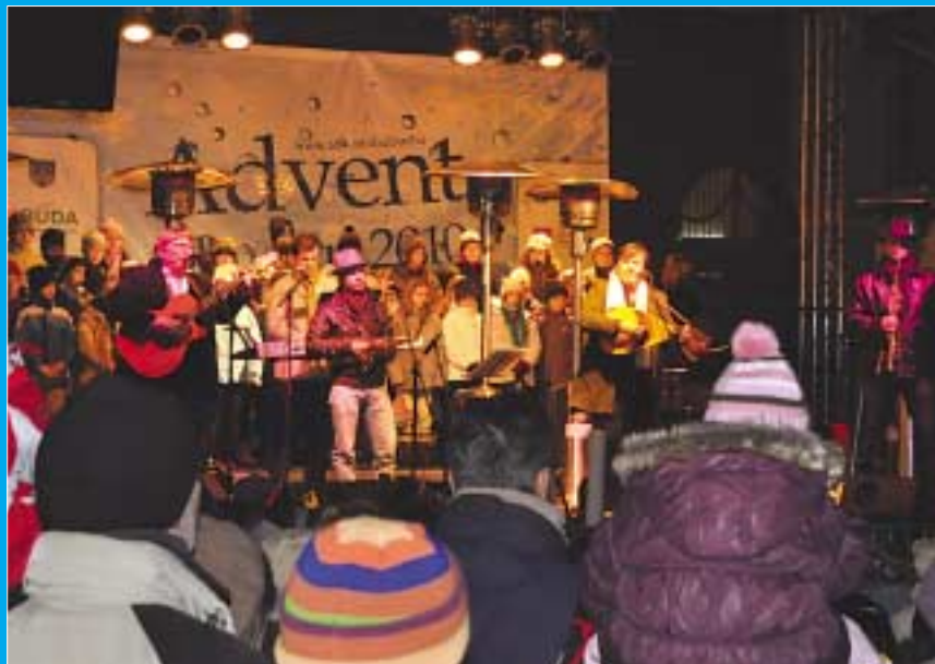
A Ghymes koncerten az Óbudai Szent Péter és Pál Szalézi Általános Iskola tanulói vendégszerepeltek