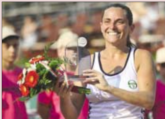
A torna boldog győztese Roberta Vinci

Márky Jenő soha nem adja fel. Az év elején még úgy tűnt, a világ negyven legnagyobb női tenisz rendezvénye közé sorolt hazai WTA torna elmarad, mivel az addigi főszponzor nem tartotta be a jelentkezési határidőt. A Római Teniszakadémia (RTA) tulajdonosa azonban egy percig sem nyugodott bele, hogy a főváros rangos teniszesemény nélkül maradjon.