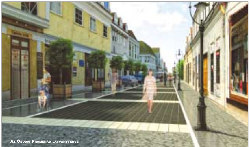
AZ ÓBUDAI PROMENÁDNÁL LÁTVÁNYTERVE

dés, de tulajdonképpen a kerület sem zárkózik el tőle. Többnyire az itt lakók érdekében kényszerülünk arra, hogy előbb-utóbb lépünk valamit. Az agglomerációból érkezők ugyanis néhol teljesen elfoglalják a parkolókat egész napra, így a helybeliek a saját otthonuk közelében egyszerűen képtelen letenni az autójukat. Ezért például az Árpád híd környékén, a HEV-megállóhoz közeli utcákban, illetve a Kolosy téren valóban be-