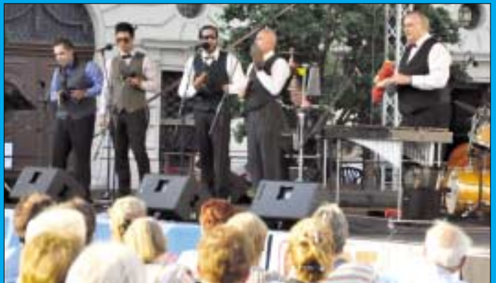
Hazánk egyik legnépszerűbb és egyik legismertebb tradicionális jazz zenekara a Budapest Ragtime Band. A hagyományos és mindenki által jól ismert jazz dallamok mellett népszerű tánczenei számok, komolyzene, operett is szerepel koncertjeiken. Elmaradhatatlan volt a show, a vidámság és a móka a július 9-ei Fő téri előadásán is