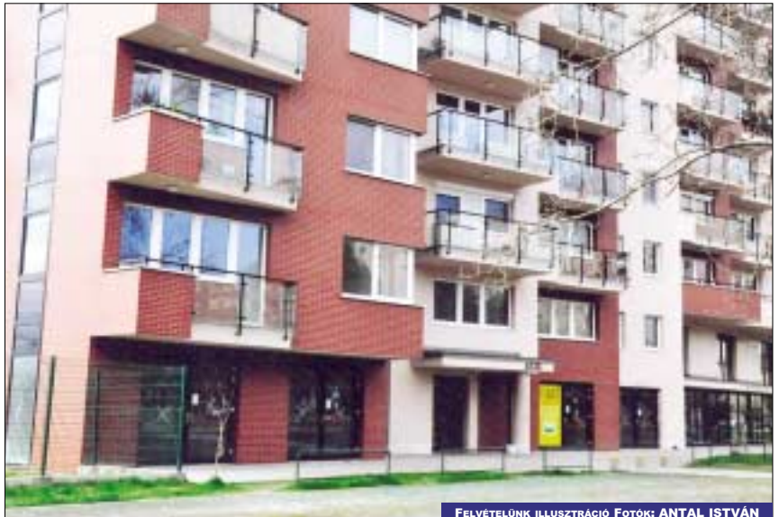
FELVÉTELÜNK ILLUSZTRÁCIÓ

A téglalakások ára jobban tartja magát: akár a duplájába is kerülhet a paneleknek. Óbudán mindenesetre ez a kép, de más kerületekben nem ilyen óriási a különbség. Van, ahol mindössze 10