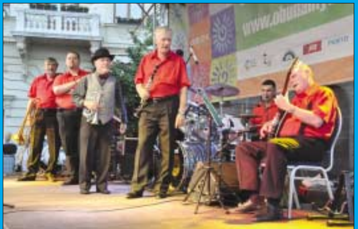
BENKŐ DIXIELAND BAND. Az 1957-ben alakult együttes a világon az egyik legnagyobb sikorsorozatot felmutató zenekar. Az elmúlt évtizedekben hungarikum lett, számaikat a közösségi oldalakon is rekordmennyiségű hallgató élvezte. Ezekből a népszerű számaikból mutatták be a rájuk legjellemzőbbeket az Óbudai Nyár közönségének, július 22-én a Fő téren, ahol minden korosztály megtalálta a kellemes kikapcsolódást