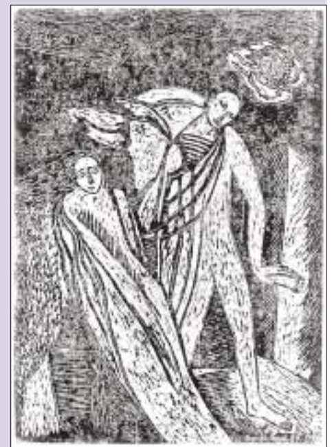
Benyó Ildikó: A két filozófus (1989)

Siratlak, siratlak - testvérem, mindenségem, ősz nap sugar - a tavalyi szeptemberre gondolok, amikor még hallottam hangodat, testvérem, siratlak, siratlak, milliószor siratlak! Az égbolt rám terül gyöngyházfényével - olyan törekenyen, elesetten, olyan segélykérően néztél rám, siratlak, siratlak - testvérem, mindenségem! A Föld, az ég és a Nap is sirat téged, az istenáldotta művészt, a legmagányosabb csillagot, testvérem, mindenségem! Színek mágusa! Varázslónő! Szomorú, bánatos arcod néz rám a túlvilágból is - hatalmas vihar, tornádó tombolt szívedben - mégis elhottad a Földre a csodát. Tisztító tűz voltál, siratlak, siratlak, testvérem, mindenségem!