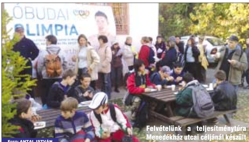
Felvételünk a teljesítménytúra Menedékház utcai céljánál készült