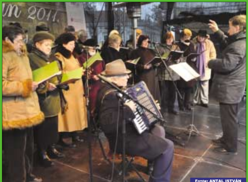
A Brauhaxler Dalkör tagjai karácsonyi énekekkel lepték meg a közönséget