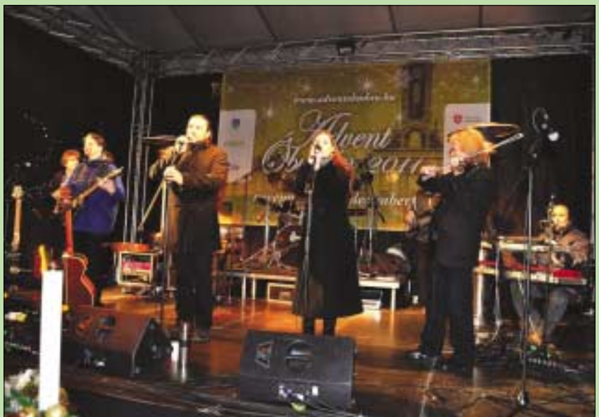
Kormorán koncerttel zárult advent első szombatja