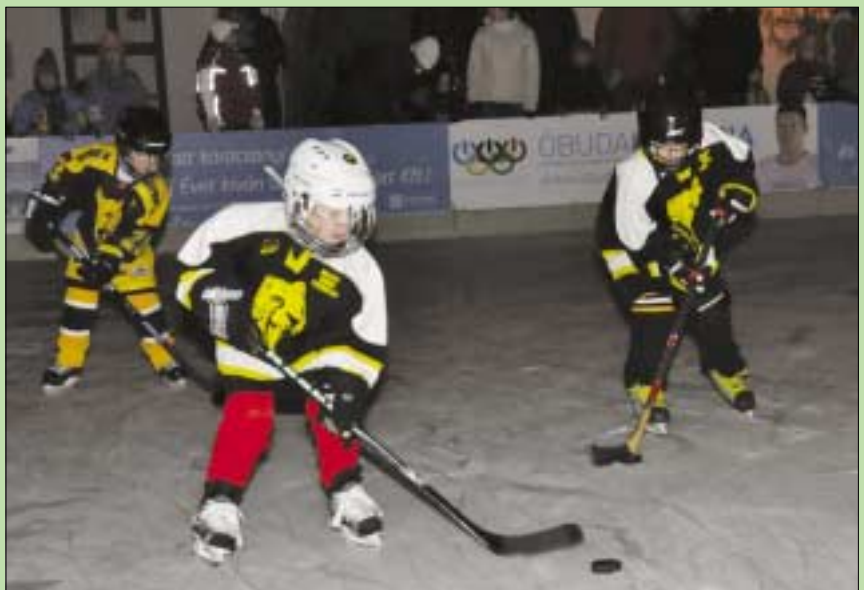
A Gepárd Jégkorong Egyesület avatta fel a korcsolyapályát