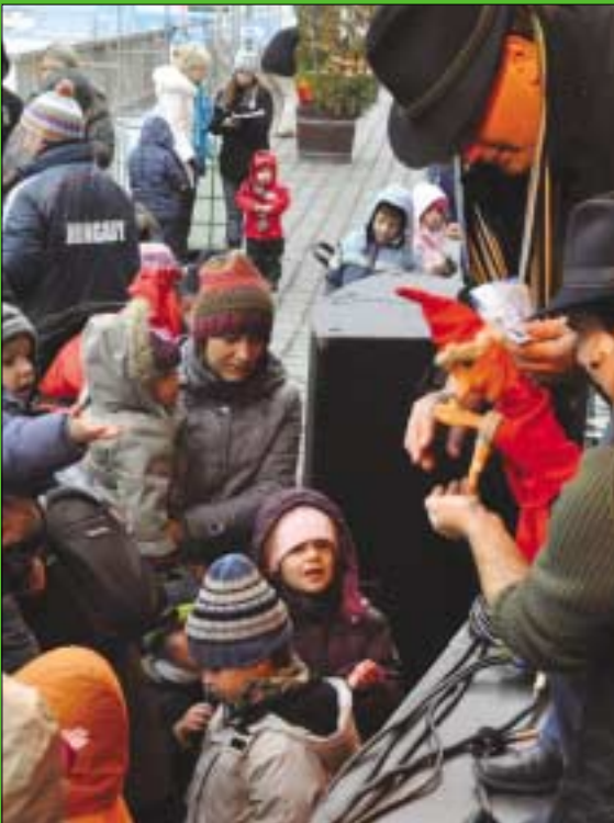
A Paprika Jancsi című bábjátékot mutatta be az Aranykapu Bábszínház