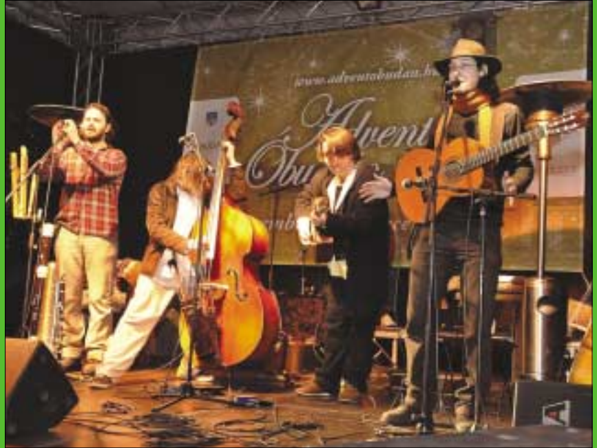
Dsida Jenő költeményeiből válogatott a Misztrál Együttes