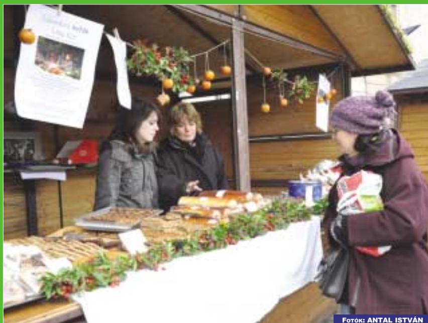
A Liliomkerti kofák zamatos sajtokat, kenyérkülönlegességeket kínáltak