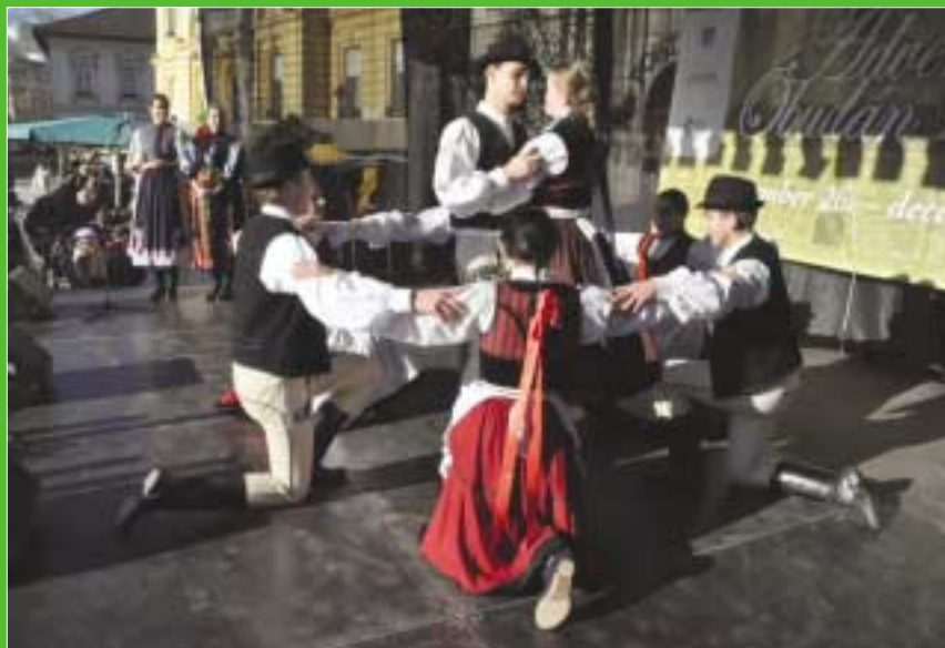
A Kincső Együttes néptáncsal szórakoztatta a Fő térre látogatókat