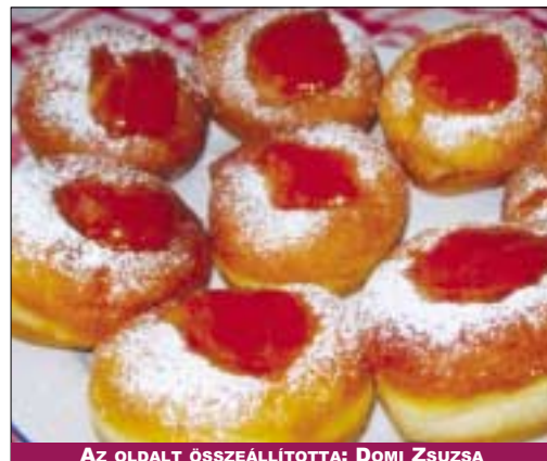
AZ OLDALT ÖSSZEÁLLÍTOTTA: DOMI ZSUZSA