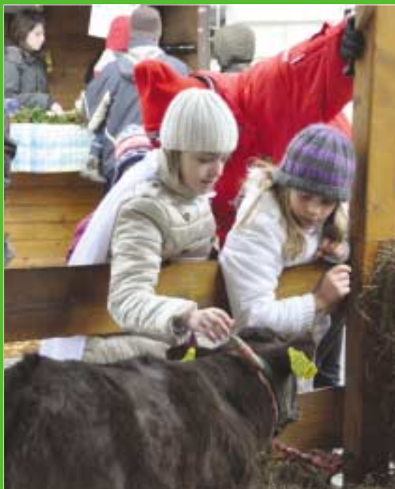
Bocit, szamarat, pónilovat és bárányt simogathattak a gyerekek és a felnőttek