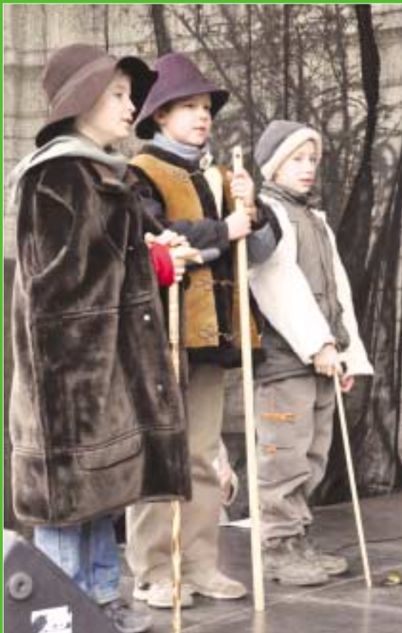
A Mustármag Keresztény Óvoda, Általános Iskola és Gimnázium diákjai adventi műsorral lepték meg a közönséget

Az adventi hétvégeken tartalmas programokkal várták az érdeklődőket a Fő téren. Képriportunkban advent harmadik és negyedik szombatjáról, vasárnapjáról számolunk be, a színes eseményekből válogatva.