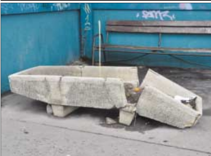
Vandalok törték szét a virágtartót a Vörösvári úton

Bolti lopásnak indult, azonban rablás lett abból, hogy az egyik békásmegyéri Tesco Express üzletből szalámikat akart elvinni egy tettes tavaly novemberben. Tervét megghiúsította a biztonsági őr, aki tetten érte a bolti tolvajt. Miközben az irodába kíséerte az elkövetőt, az kirántotta magát az őr fogságából és menekülni kezdett. Az őr utolérte és dulakodni kezdtek, melynek végén a gyanúsított el tudott ugyan menekülni, később azonban kézre került. Azért lett az alkalmi lopásból rablás, mivel az elkövető a lopott érték megtartása érdekében erőszakot alkalmazott.