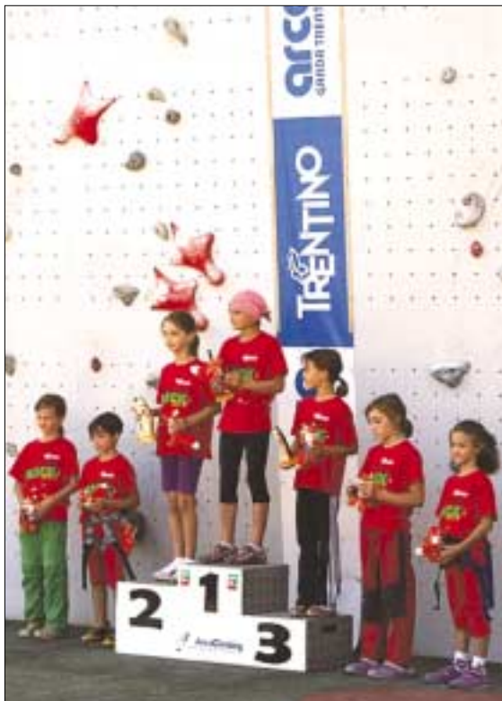
Korosztályában a magyarok közül elsőként nyert nemzetközi versenyt

Jó időbeosztásának köszönhetően a tanulás mellett a sportolásra is jut ide-