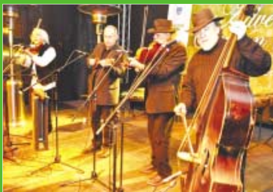
A Muzsikás Együttes zárta advent utolsó hétvégéjének programjait