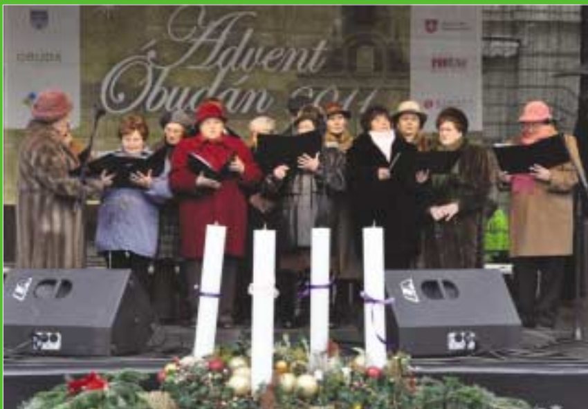
Az Óbudai Szociális Szolgáltató Intézmény ünnepi előadása