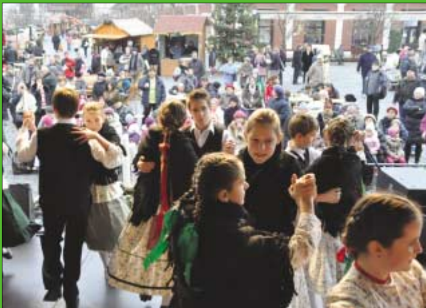
Néptánc a Bojtár Népzenei Egyesület tolmácsolásában