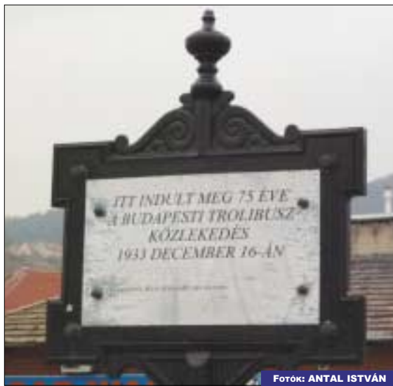
75 éve erről a helyről indult a budapesti trolibusz közlekedés - hirdeti az emléktábla a 17-es villamos végállomásán