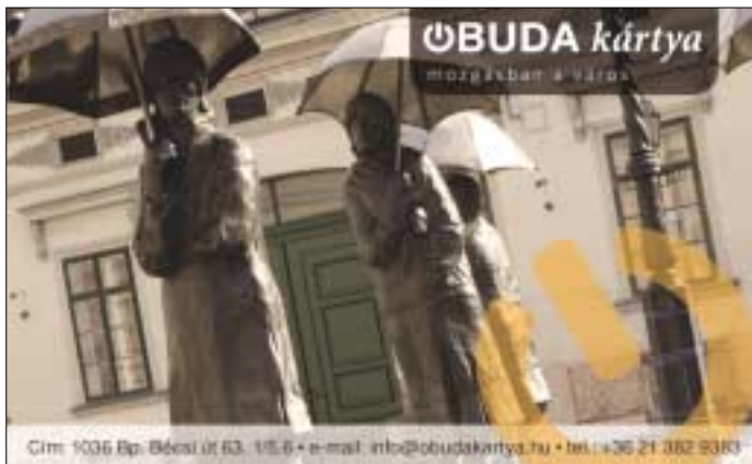
Cím: 1036 Bp. Bécsi út 63. 1/5-6 • e-mail: info@obudakartya.hu • tel.: +36 21 382 9383