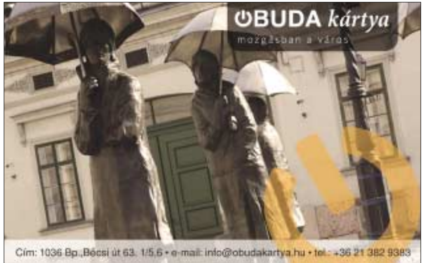
Cím: 1036 Bp., Bécsi út 63. 1/5-6 • e-mail: info@obudakartya.hu • tel.: +36 21 382 9383

Amennyiben belépési nyilatkozatot igényelne,