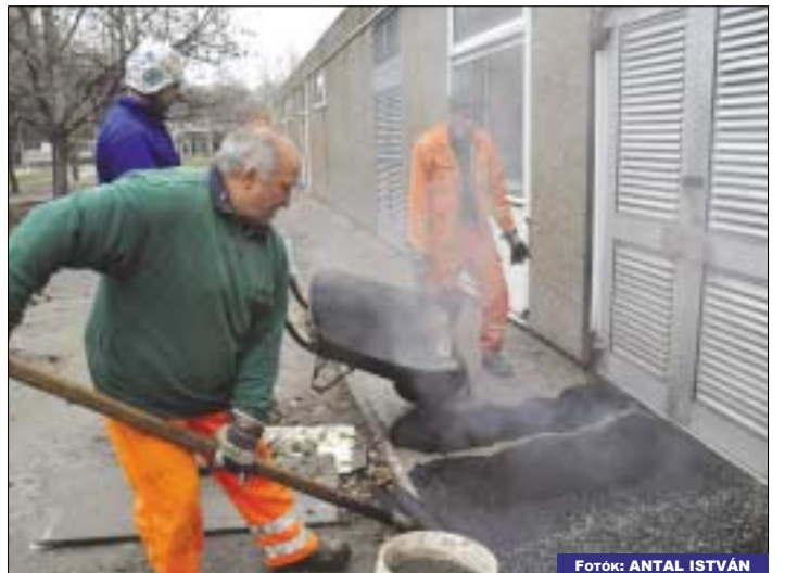
A feltoredezett járdaszakaszt aszfaltoztak a békásmegyeri járóbeteg-szakrendelőnél