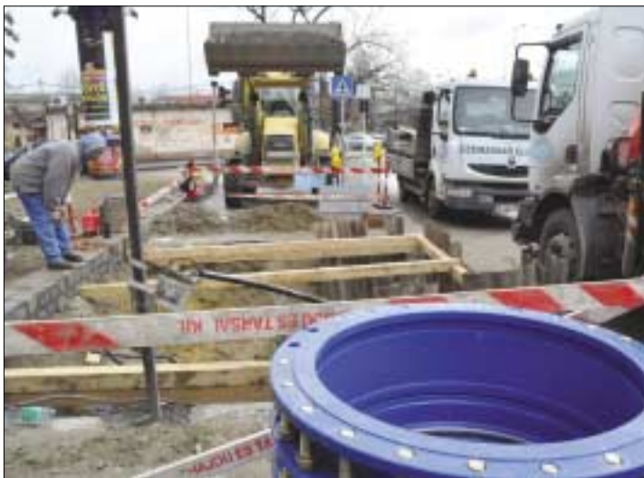
800 milliméteres tolózárcserét végeztek a Szentlélek tér alatti vízvezeték-hálózaton a szakemberek

Észak-buda hegyvidéki útvonalain futnak tavasztól azok a használt Mercedes buszok, amelyeket a közelmúltban vásárolt a BKV. Az alacsonypadlós, rövid járművekben 550 ezer kilométer teljesítmény van.