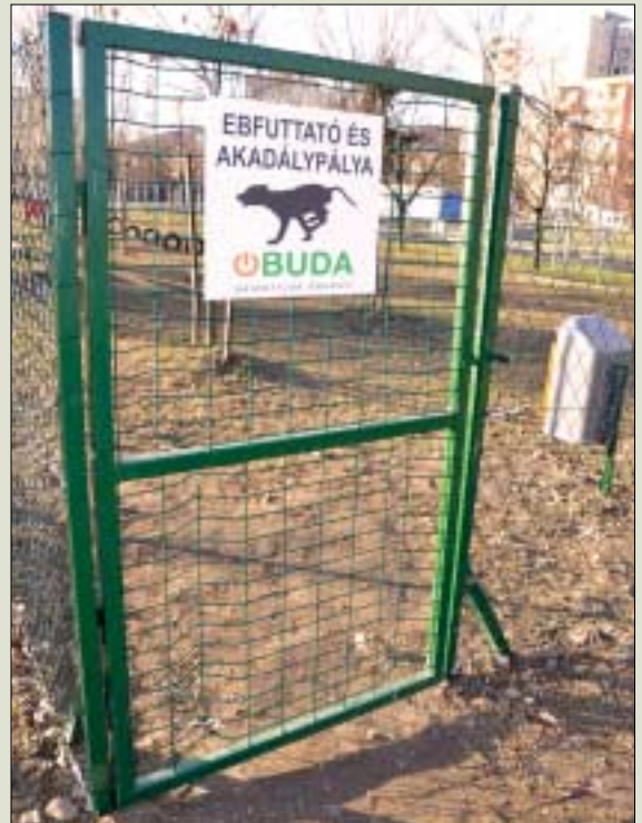
Akadálypályát, paláncsort és mérleghintát is kaptak a kutyák

Tisztasága érdekében kutyaurülék- és hulladékgyűjtő ládákat is felszereltek. Ezzel együtt már 10 helyen lehet a III. kerületben a kutyákat póráz és szájkosár nélkül szabadon engedni.