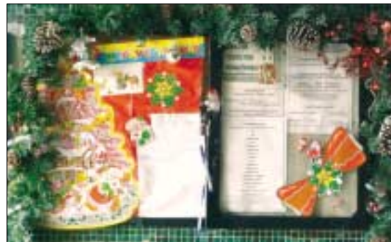
Lakók által készített adventi „hirdetőtábla” a Vörösvári út 27. szám alatt

Am, a hollandiai Groningenben tartott díjátadó gálán az is kiderült, hogy a Szigetet nemcsak a közönség, de a zenészek is a legjobbak közé sorolták, ami tovább emeli az idén már 20. évébe lépő rendezvény megítélését.