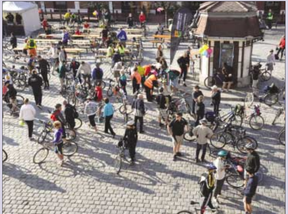
Gyülekező Óbuda szívében, a Fő téren