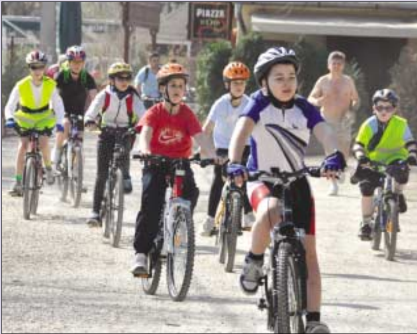
A kerekezők a Római-parton át tekertek Békásmegyerve