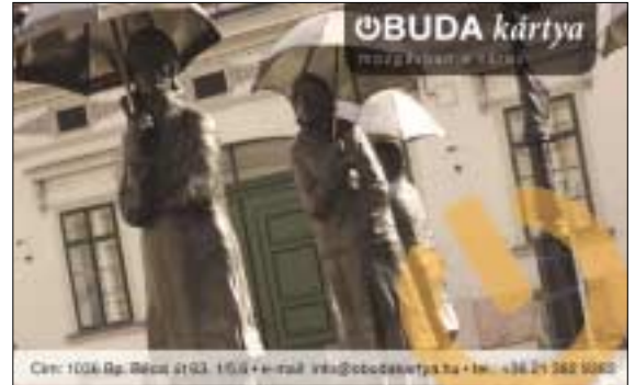
Cím: 1036 Bp. Bécsi út 31-33. 1500+4-eszál: info@obudakartya.hu • Tel: +36 21 362 5080

Partneri és reklámszerződést kötött az önkormányzat a CBA-val, mely szerint Óbuda-Békásmegyeren mind a tíz boltban használható lesz az Óbuda Kártya. A kártyák gyártása elkezdődött, várhatóan májusban minden igénylő megkapja. Természetesen továbbra is ingyenesen kérelmezhetik a kerületi lakosok. A partneri szerződéskötések folyamatban vannak. A leszerződött partnerek bővülő listája az obudakartya.hu honlapon követhető nyomon.