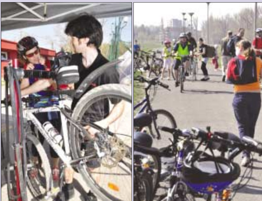
A szervezők három szervíz és frissítő állomással várták a biciklistákat