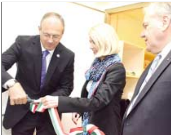
Szócska Miklós egészségügyért felelős államtitkár adta át az új MRI készüléket

A 3 Teslás MRI gép lényege, hogy nagyobb felbontóképességű képet készít az egész testre vonatkozóan, ezzel a különböző betegségek diagnosztizálását már korai stádiumban is segíti. A készülék a végtagok, a törzs és a koponya gyulladásos, daganatos, traumás, kopásos elváltozásait és az anyagcsere-betegségek anatómiai elváltozásait is megmutatja. Az ORFI-ban főleg kóros mozgásszervi folyamatok diagnosztikájára használják a berendezést, így ízületi gyulladások, porc- és lágyszövet sérülések, gerincsérvek és egyéb gerincbetegségek korai felismerésére. Az MRI labor hetente ötször 14 órában működik. Óránként három beteg vizsgálatára alkal-